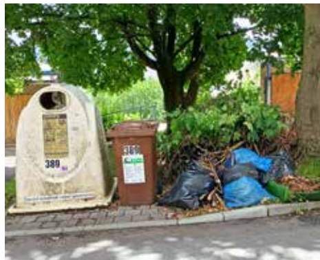
Takhle ne! Snímek, jak se s odpadem nenakládá, je z ulice Nad Stráněmi.

Město Zlín se v posledních letech intenzivně zaměřuje na efektivní nakládání s odpady, přičemž jedním z klíčových aspektů je problematika rostlinného odpadu.