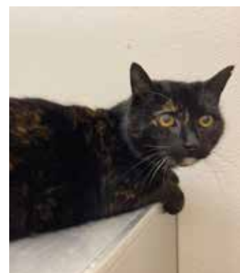
ČÍČA – žihaná kočička, klidná, nenáročná a přítulná, 9 let, kastrovaná, uměla jí majitelka