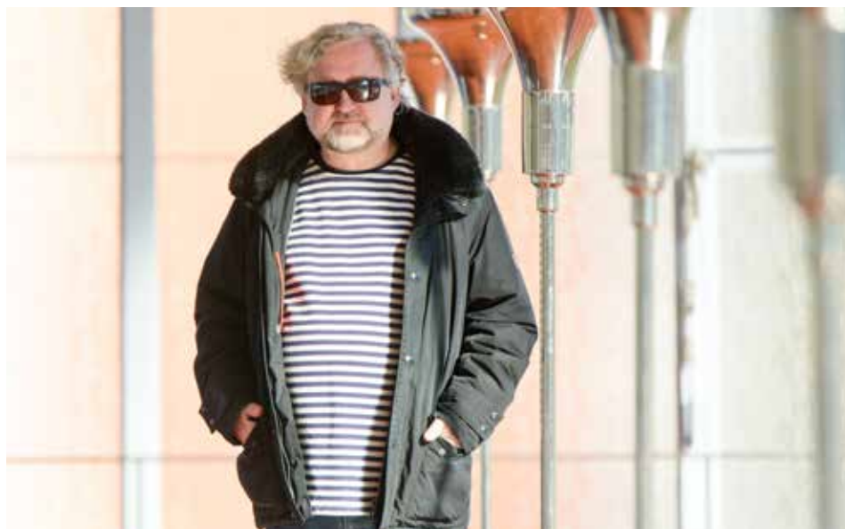
Režisér Jan Hřebejk natáčí ve Zlíně dva díly z detektivního cyklu Místo zločinu. Česká televize začne seriál vysílat od ledna 2026 vždy v pondělí v hlavním vysílacím čase, tedy ve 20 hodin.

Jan Hřebejk se bez diskuse řadí k nejlepším českým režisérům. K výčtu jeho filmové, televizní a divadelní tvorby by jedna strana magazínu, který si právě čtete, nestačila. Kdo by neznal jeho první celovečerní snímek Šakalí léta. Nebo Musíme si pomáhat, Horem pádem, Pupendo, Krásku v nesnázích. Spousta lidí by měla pokažené Vánoce, kdyby mezi svátky alespoň jednou neviděla Pelíšky.