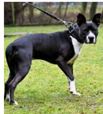
ATILA – kříženec staforda, 3 roky, pro aktivního a zapáleného pejskaře, k lidem přátelský, se psy má problém

kterým se bývalý majitel hodně věnoval, ale přestával zvládat jejich péči a neměl již odpovídající chovné podmínky. Čtyři z nich stále hledají nový domov, takže pokud uvažujete o pořízení nového člena do rodiny, podívejte se na naše webové stránky www.utulekzlin.cz . My vám ve fotogalerii nabídneme jednoho z nich. /red/