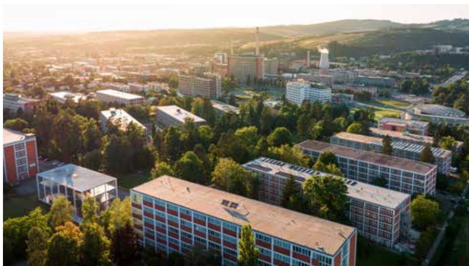
CCRV, foto: Martin Bernard

Představte si, že stojíte na vrcholu Baťova mrakodrapu, nejvyšší budovy ve Zlíně. Pod vámi se rozprostírá město, které vypadá, jako by ho někdo vystříhl z učebnice architektury.