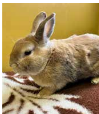
BAILEY – králík, samec, 2 roky, zvyklý žít ve společnosti ostatních králíků