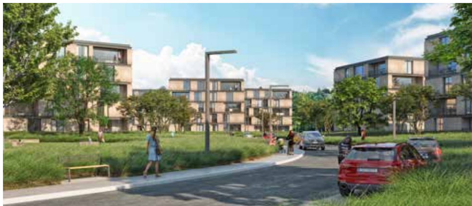
Město Zlín se dál rozvíjí, novou lokalitou pro bydlení bude Boněcký rybník

Celkem až 400 bytů, z toho 280 na městských pozemcích a 120 na parcelách soukromých investorů nabídne nová městská rozvojová plocha Boněcký rybník. Její vznik chystá radnice na zhruba třech hektarech ve východní části Zlína.