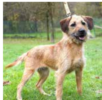
BESY – fenka křížence teriéra, 6 let, kastrováná, vhodná pro aktivní rodinu, která zná a má ráda teriéry