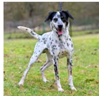
LUCKY – kříženec dalmatina, 3 roky, vnitřní a temperamentní, potřebuje pravidelné vycházky a vedení