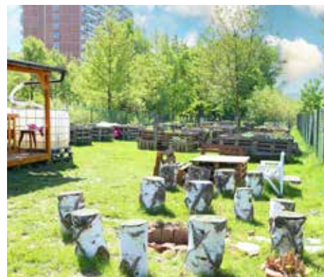
Komunitní zahrada Jižní Svahy, vítězný projekt Tvoříme Zlín 2018

Veřejnost se může s dotazy na participativní rozpočet obrátit také přímo na koordinátorku