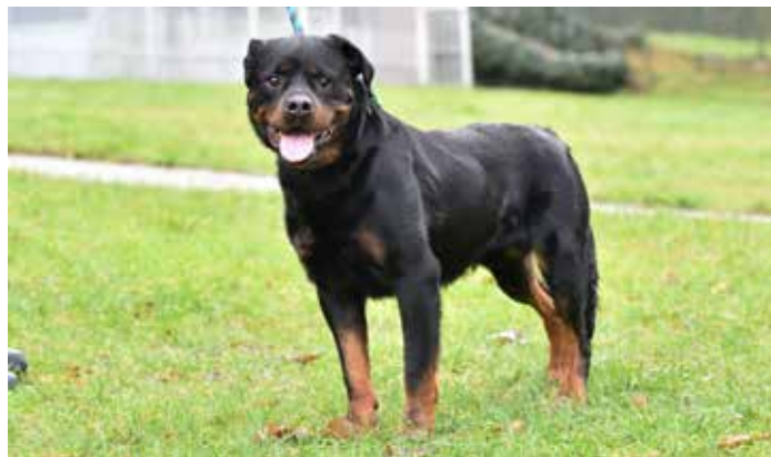
ROCKY – rotvajler, 7 let, ovládá základní povely, pro aktivního a zkušeného majitele, na útulku čeká 1,5 roku