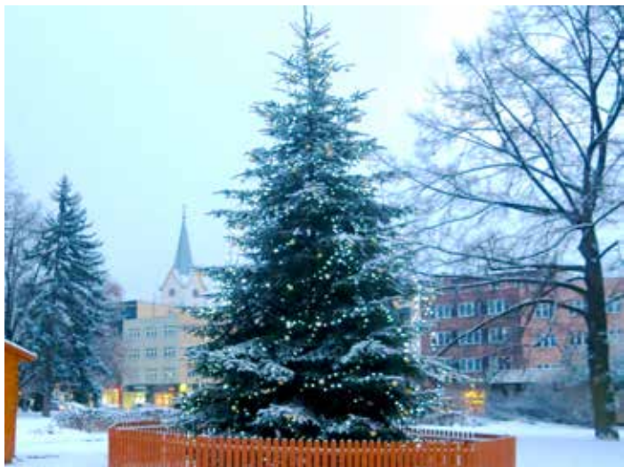
Nejen na náměstí. Vánočních stromů bude 13.

Ve Velíkové se strom rozsvítí 9. prosince v rámci Mikulášské besídky, která začíná v 16.00 v sále. V místní části Klečůvka se 2. prosince ve 14.00 uskuteční Mikulášská dílna a výstava betlémů. Strom na fotbalovém hřišti nebude mít osvětlení, ale do jeho zdobení se mohou zapojit všichni přímo o Štědrém dnu. Místní mají v plánu i štěpánský a silvestrovský fotbalík a 29. prosince vyjít do Uherského Brodu. [io]