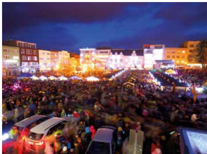
Jarmark má skvělou atmosféru.

Dvacet jedna dní plných živé zábavy, voňavých dobrot na zahřátí a také možností pořídit zajímavý vánoční dárek. To vše a mnoho dalšího nabízí Adventní čas, jehož součástí je také Vánoční jarmark. Ten letošní začíná v neděli 3. prosince slavnostním rozsvícením stromečku. Samotný jarmark s mnoha desítkami prodejců odstartuje 9. prosince.