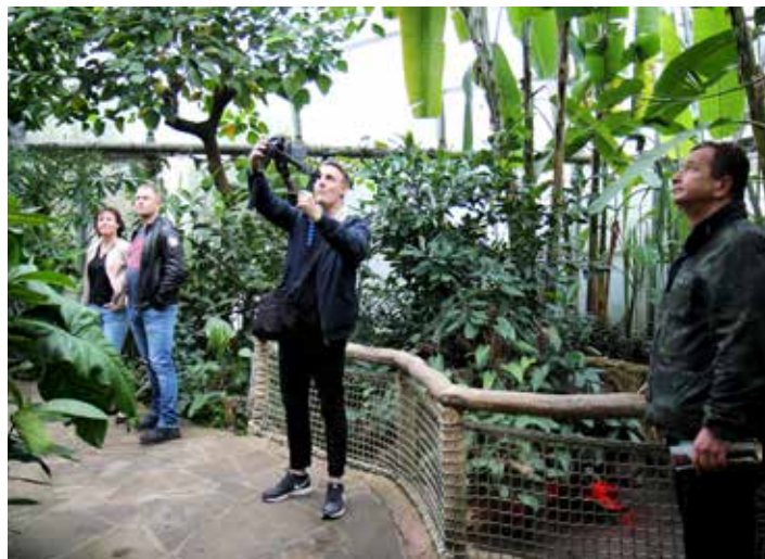
Natáčení probíhalo na mnoha atraktivních místech.

odborníků z Ameriky a zejména z Čech. Zapojeni do spolupráce jsou i studenti z Gymnázia a jazykové školy Zlín, kteří také vytváří vysílání školní televize T.G.M. Czech-American TV spolupracuje také se Zlínským krajem. [dvo]