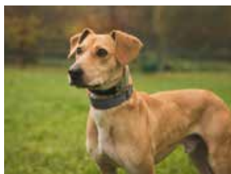
RAP. / foto: útulek