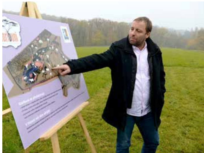
Začala stavba areálu Karibuni.

„Pobídky jsou koncipovány jako návratné investice, takže peníze, které filmaři dostanou, ve výsledku ve Zlínském kraji zůstanou. Navíc ale vytvoří přídanou hodnotu ve formě podpory tradičních řemesel, poskytnutí praxe místním studentům filmových oborů, zviditelnění regionu a tak dále,“ uzavírá Jindřich Motýl , předseda Regionálního filmového fondu z. s. – neziskové organizace, která založila ZLÍN FILM OFFICE. [zfo]