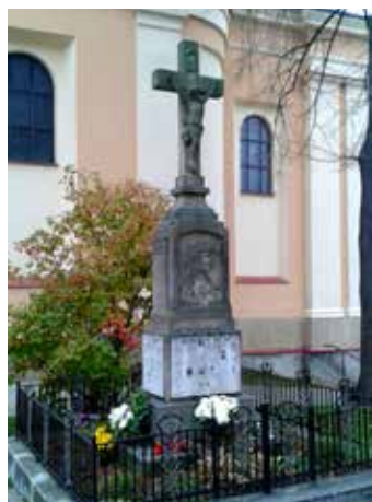
Památník v Malenovicích.