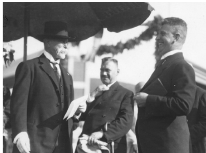
Prezident na tribuně v továrním areálu. / foto: Řehák-Evják 1928, SOkA Zlín