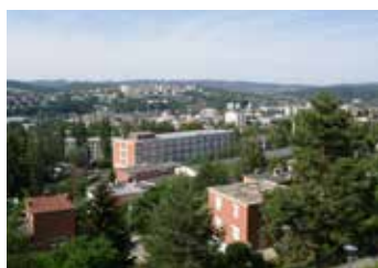
Město stojí o dohodu.

Město Zlín bude s členy Bytového družstva Podlesí (BDP) komunikovat napřímo. Hlavním důvodem jsou konfrontační aktivity, jež vůči němu vyvíjí předseda BDP Pavel Sekula a další členové představenstva tohoto bytového družstva. Potvrdilo se také, že přes představenstvo se k členům družstva nedostávají všechny informace, které se jim město snaží předat a které mají pomoci vyřešit budoucnost BDP.