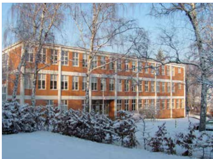
Město zřizuje mimo jiné 13 základních škol.