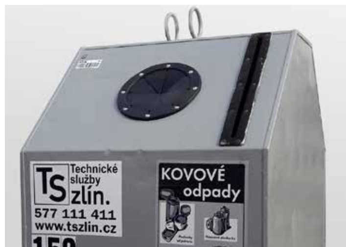
Kontejner na kov.

Do nádob odkládejte jak hliníkové plechovky od nápojů, tak kovové nádoby od masa a ovoce. Svoz nádob bude probíhat 1x měsíčně. [red]