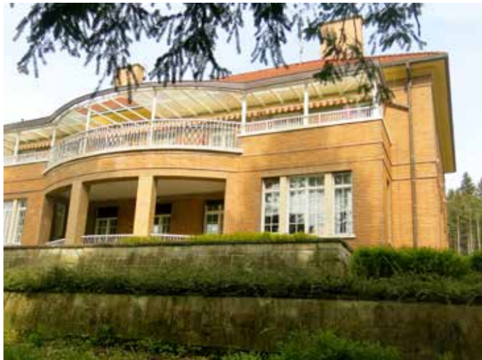
Dětské centrum sídlí v Čiperově vile.