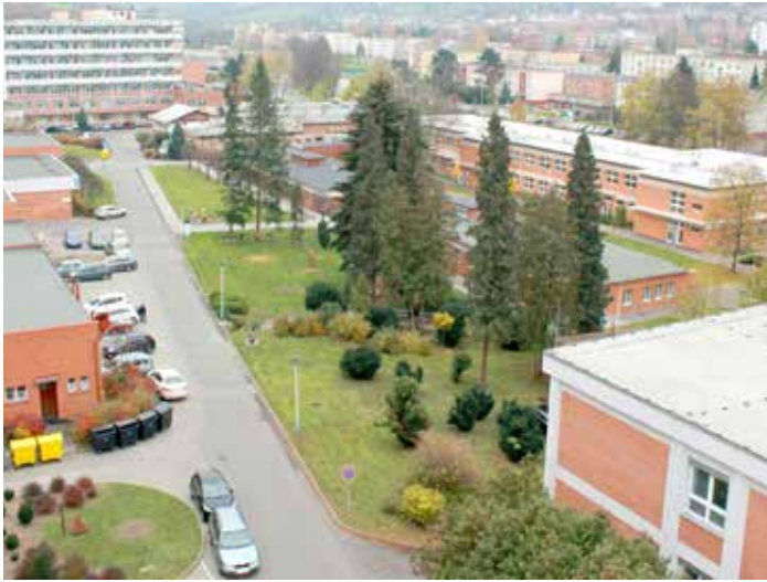
MHD by mohla dopravě v areálu ulevit.

hodinou ranní a 15. a 16. hodinou odpolední. „Linka MHD v nemocnici nebo těsně u ní by mohla výrazně snížit počet aut v areálu. Narazili jsme ale na problém trasy případného autobusu – průjezd nemocničním areálem není možný bez stavebních úprav. Například některé zatáčky jsou příliš úzké. Proto zvažujeme i variantu vytvoření zastávek podél nemocnice,“ uvedl ekonomicko-provozní náměstek Vlastimil Vajdák a dodal, že ještě budou probíhat další jednání s městem Zlínem. „Do konce roku bychom snad mohli mít jasno,“ konstatoval. [dl]