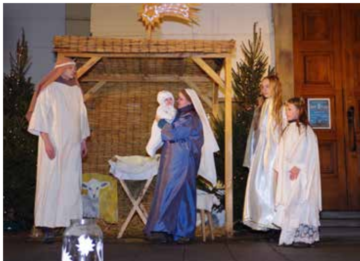
Živý betlém.