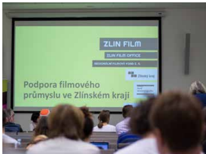
Zlín a celý kraj se snaží přilákat filmaře.

Na místě bude cena vstupenky pro dospělé 190 Kč (pro děti zůstává cena stejná). [sur]