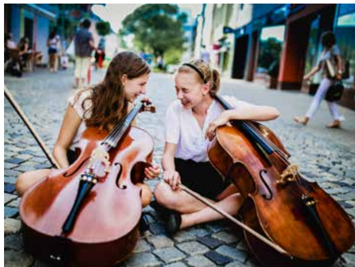
Snímek má premiéru 29. listopadu.