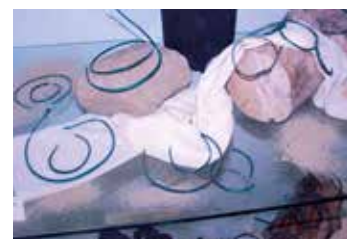
Výstava šperků.

třemi tisíci lety. Výstavu najdete v prvním patře radnice. Přístupná bude do poloviny prosince. [red]