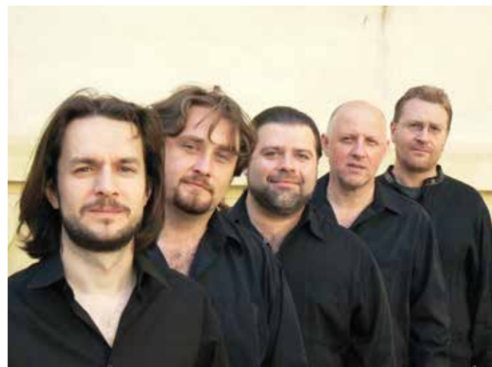
Vokálně experimentální soubor Affetto.

Vstupenky jsou k dispozici v Městském informačním středisku na náměstí Míru nebo na místě 30 minut před začátkem koncertu. Plné vstupné stojí 150 korun, zlevněná vstupenka pro studenty, seniory a držitele průkazu ZTP 100 korun, děti do 15 let zdarma. [st]