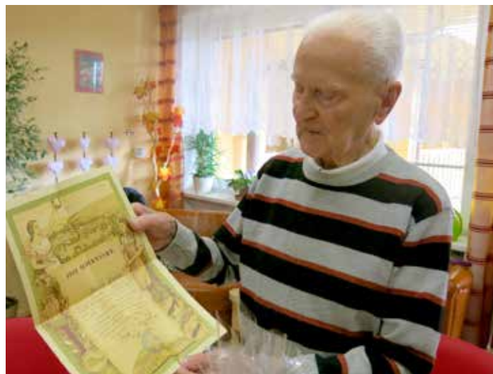
100 let, denně 20 dřepů.