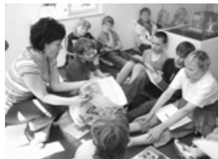
Animační program v expozici „Bydlení v baťovském Zlíně“