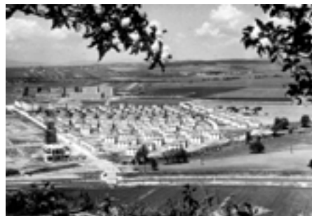
Slovenské Baťovany 1946