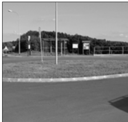
Točna na Kudlově.

Největší investicí, která byla na Kudlově realizována v posledních letech, je rekonstrukce komunikace II/490, která byla realizována ve třech etapách. Jednalo se o sdruženou investici města Zlína a Ředitelství silnic Zlínského kraje. V roce 2006 byla postavena nová točna