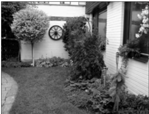
1. místo I. kategorie