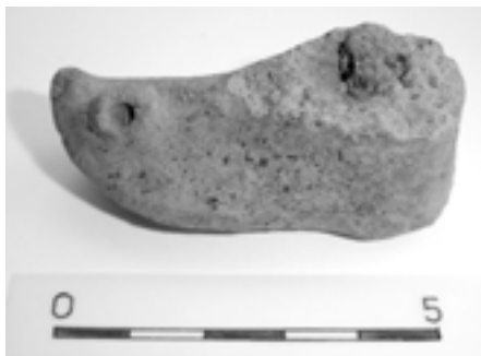
Zlomek hliněné plastiky z Rýsova

Rýsov - majestátní zalesněný vrchol Vizovických vrchů zvedající se nad Provodovem nedaleko Zlína je v očích odborné i širší veřejnosti dodnes spojován především s nálezem zlatých keltských mincí, které se na jeho svazích nacházely již od konce 19. století. Část úzkého protáhlého hřebene zaujímá pravěké hradisko o rozloze zhruba 1,5 hektaru, zbytky jehož opevnění v podobě valů se místy dochovaly až do výšky 3 metrů, a v místech skalnatého pískovcového výchozu zvaného Čertův kámen byl v roce 1983 lokalizován archeologickým výzkumem středověký hrad Rýsov.