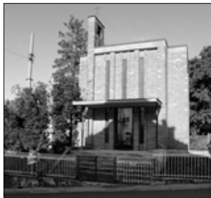
Kaple sv. Václava.

V posledních 3 letech se velmi rozrůstá výstavba nových domů, vznikly 3 nové ulice a výstavba stále pokračuje.