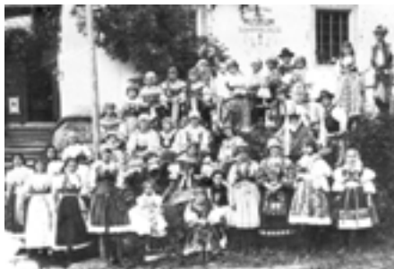
Z otevření muzea 1918