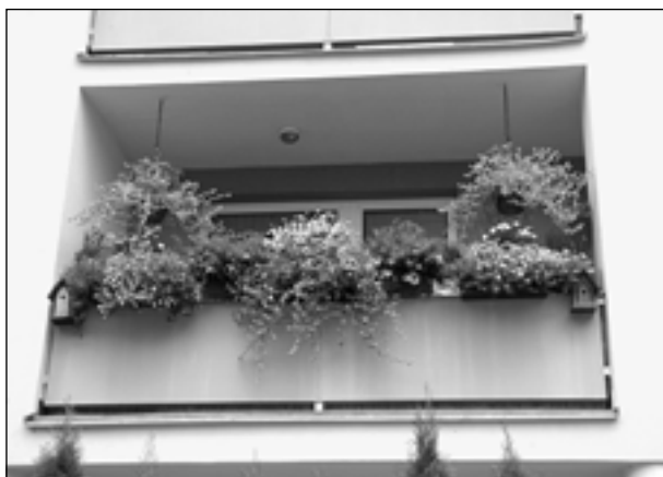
1. místo II. kategorie

Komise procházela během dvou dnů všechny přihlášené zahrady, předzahrádky a zhlédla balkony a okna. Při hodnocení se kladl důraz především na harmonii barev, kompoziční uspořádání, respektování nároků rostlin, jejich zaplevelení a zdravotní stav. U veřejně přístupných výsadeb (např. u panelových domů) komise také oceňovala houževnatost, s jakou někteří obyvatelé dokáží i přes nepřízeň okolí kultivovat obytný prostor. Konečný verdikt byl tedy souladem nejen uvedených hodnotících kritérií, ale celkového dojmu, který zanechala zahrada či balkonová výsadba na každém z nás.