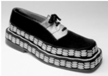
Exkluzivní dámská polobotka z kolekce pro světovou výstavu New York 1939 je součástí sbírkového fondu Obuvnického muzea.

O formě československé účasti a podobě expozice na World's Fair 1939 v New Yorku se živě diskutovalo v odborných kruzích již na jaře 1938. Mimo zainteresovaných institucí se v této záležitosti angažovali i přední čeští podnikatelé, mezi nimi i Jan Antonín Baťa. Ve firemním časopise Zlín byl otištěn 15. dubna 1938 jeho úvodník pod názvem Newyorská výstava - Zabraňte národní ostudě! : „Zatímco jiné země dokončují pavilóny, československé instituce se dohadují o kompetencích“, horlil. Ve Zlíně byla tehdy nejdůležitějším projektem výstavního oddělení právě příprava exponátů pro EXPO New York 1939 a v modelárně firmy Baťa vznikala exkluzivní kolekce dámské obuvi, která svým nadčasovým designem, luxusními materiály a dokonalým zpracováním předčila tvorbu mnohých věhlasných návrhářů.