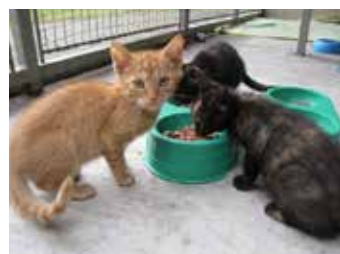
PURINA, PECKA.

PURINA, PECKA – kočky žíhané, asi 2,5 měsíce staré, odčervené. Vhodné do domácnosti s dětmi.