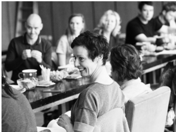
Na zkoušce Idiota.