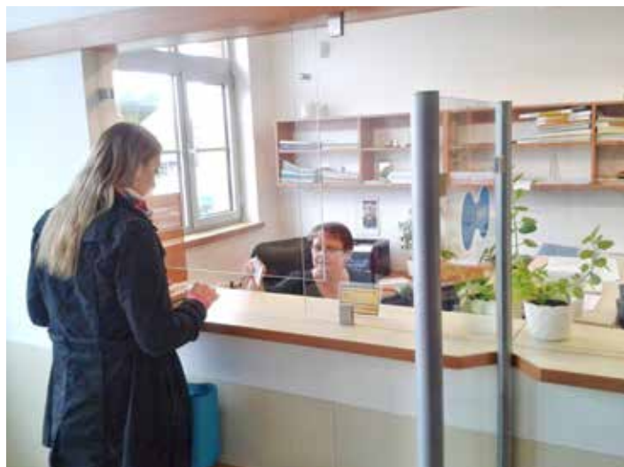
S činností tohoto odboru se setká každý.

Referenti dopravních přestupků se zabývají jak přestupky souvisejícími s objektivní odpovědností