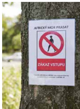
Zákazová značka.

Právě v těchto dnech se Zlínsko potýká s bojem proti africkému moru prasat. Zároveň je však nyní období výletů, procházek i sběru lesních plodů. Dá se tedy očekávat, že se lidé mohou ve zvýšené míře setkat s uhynulými divokými prasaty. Státní veterinární správa tak vydala metodiku, jak v takovém případě postupovat. Postup při nálezů uhynulého divokého prasete v zamořené oblasti „civilní“ osobou