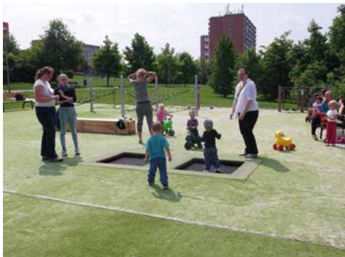
Pro děti je potřeba udělat maximum. / ilustrační foto

Již deset let se stará o chlapce, kterému hrozilo umístění do dětského domova. Má tedy s pěstounstvím své zkušenosti a rád by se o ně podělil. I prostřednictvím Magazínu Zlín.