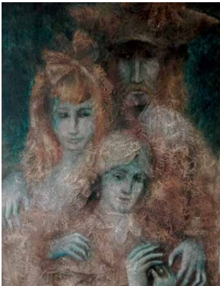
Z díla Taťány Havlíčkové.

Po revoluci to hoši zprivatizovali a poslali nás domů. Všichni tvůrčí pracovníci byli propuštěni, a dělejte film ve Zlíně na volné noze!