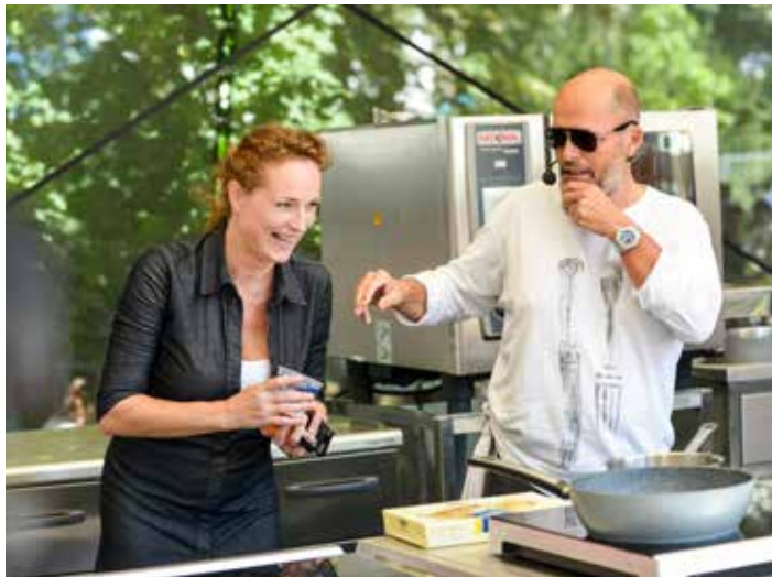
Tvářemi festivalu jsou Kateřina Hrubešová a Zdeněk Pohlreich.