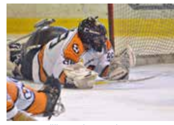
Soutěž s novým formátem.

Ze Švédska přijede na LAPP Cup tradiční účastník FIFH Malmö, ten skončil v roce 2016 šestý, tj. předposlední. Italové z týmu South Tyrols Eagles skončili na posledním ročníku druží. Rakousko bude mít dva zástupce: již pravidelný tým Carinthian Steelers, jenž loni skončil poslední, a nováčka na turnaji Warriors Vídeň. Ruského vítěze loňského turnaje, tým Fenix Moskva, vystřídá mladý tým Perspektiva Russia. Samozřejmostí je účast pořádajícího týmu SHK LAPP Zlín, sedmičku účastníků doplní slovenský tým Benccont Dolný Kubín. Turnaj i tým SHK LAPP Zlín dlouhodobě podporuje město Zlín. Měsíčník Magazín Zlín, který vydává radnice, je mediálním partnerem zlínského sledge hokeje. Více o zlínském sledge na www.sledgehokejzlin.cz . [jk, dvo]