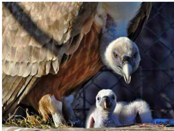
Sup bělohavý s mládětem.

Rozvoj dopravy, orientovaný pouze na automobilovou dopravu, představuje slepou uličku.