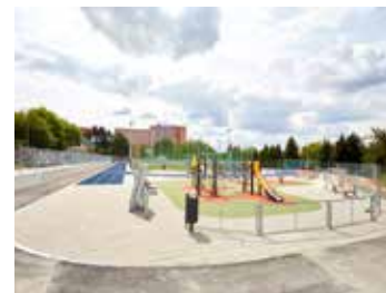
Hřiště bude i pro veřejnost.

Výraznými změnami prochází v poslední době také Stadion mládeže na ulici Hradská, což je velmi využívané sportoviště, kromě školáků také hlavně atleti, ragbisty a baseballisty. Aktuálně se zde opravují tribuny a staticky porušené opěrné zdi a chodníky.