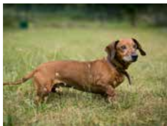
FANY. / foto: útulek

Stejně jako všechny pejskaře ve Zlíně a okolí, také chod našeho útulku ovlivnil zákaz vstupu se psy do lesů kvůli výskytu afrického moru prasat. V průběhu měsíce srpna jsme museli pozastavit venčení psů mimo areál útulku. Jelikož se za hezkého počasí v návštěvní dny obvykle dostávají na procházky téměř všichni psi, jednalo se o výraznou změnu. Psům nechybělo jen samotné venčení, ale také kontakt s lidmi. V této výjimečné situaci jsme si uvědomili, o kolik jsou naši psi ochuzeni. O pravidelnou pohybovou aktivitu s našimi pejsky byli také ochuzeni dobrovolníci, kteří k nám chodí, ale ti si na rozdíl od našich psů mohli zvolit jinou zábavu. Pravidelně k nám chodí venčit desítky dobrovolníků, s mnohými se vidáme téměř denně. K našemu překvapení jezdí psy venčit lidé i z větší dálky, například z Uherského Hradiště nebo Brna. Všem dobrovolníkům patří obrovský dík za pomoc, kvalita života našich svěřenců je zajištěna také díky vám. Doufáme, že se situace brzy vrátí zase do normálu a pejsci se dostanou zase do přírody, tak jak jsou zvyklí.