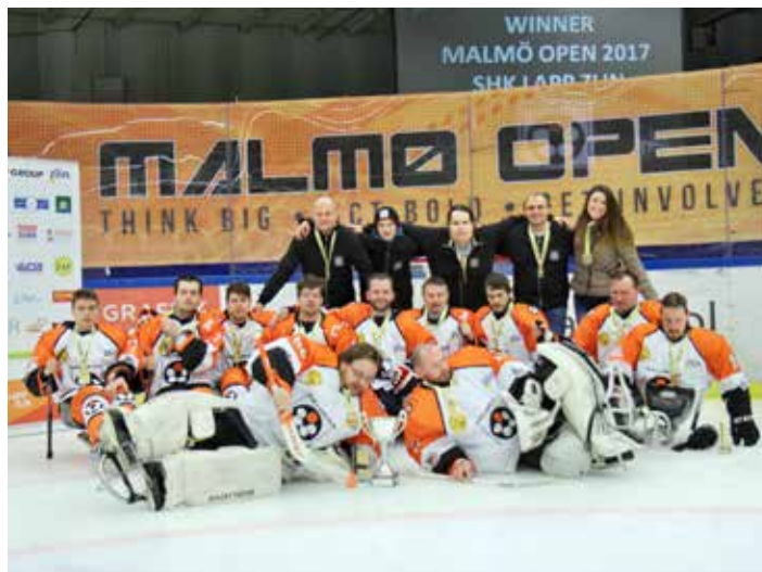
Letos vyhráli zlínské sledge hokejisty ligu i prestižní turnaj Malmö Open.

„Chytrá bota bude díky senzorům komplexně analyzovat pohyb a došlap jedince. Určená bude například profesionálním i amatérským sportovcům, vojákům, ale také pacientům s cukrovkou či po mrtvici, kteří se musí často znovu učit chodit,“ přiblížila Petra Svěráková z Centra polymerních systémů UTB. [ps]