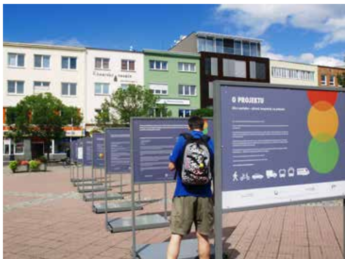
Výstava putuje městem.

Zlínská zoo tak v současnosti patří mezi nejúspěšnější chovatele supů v evropském i světovém měřítku. Navíc je jednou z mála zoo, které se daří odchovávat mláďata přirozeným způsobem pod rodiči. To je nesmírně důležité. Mláďata, která odchovávají rodiče, mají totiž mnohem větší šanci se ve volné přírodě uchytit, najít si partnera a následně vyvést vlastní potomky. Z 9 letošních mláďat sedm vyrůstá ve zlínském zoo. Mládě supu himálajského prospívá pod náhradními rodiči v Zoo Ústí, mládě supu bělohavého pod náhradním rodičovským párem v Zoo Praha. „Někdy se stane, že rodiče nejeví o snesené vejce zájem. Proto jsme se dohodli s kolegy ze zmiňovaných zoo a vejce předali do náhradní péče,“ vysvětlila Romana Bujáčková . [tz]