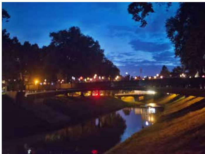
Město ožije dalšími zajímavými akcemi.