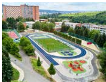
Moderní areál.