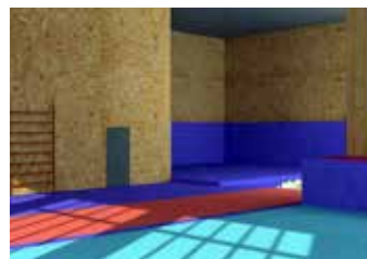
Prostor pro cvičenky.

Původně to byl obyčejný sklad. Až jednoho dne jsme dostali myšlenku: vždyť to je snad jediná hala v areálu bývalého Svitu, která nemá sloupy, takže je vhodná pro vybudování sportoviště, které pomůže všem zlínským talentům. Vytvořili jsme proto neziskový spolek Gymnas-