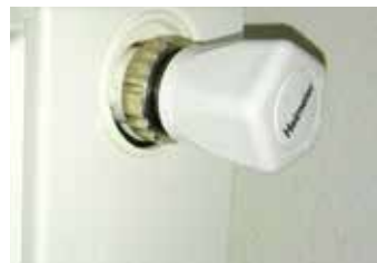
Na CZT je spolehnoutí.

Ve vytápěných objektech nehrozí nebezpečí výbuchu, požáru nebo otrava zplodinami nedokonalého spalování. [tz]