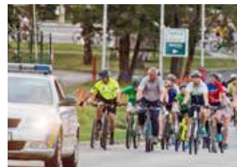
Cyklistika láká.