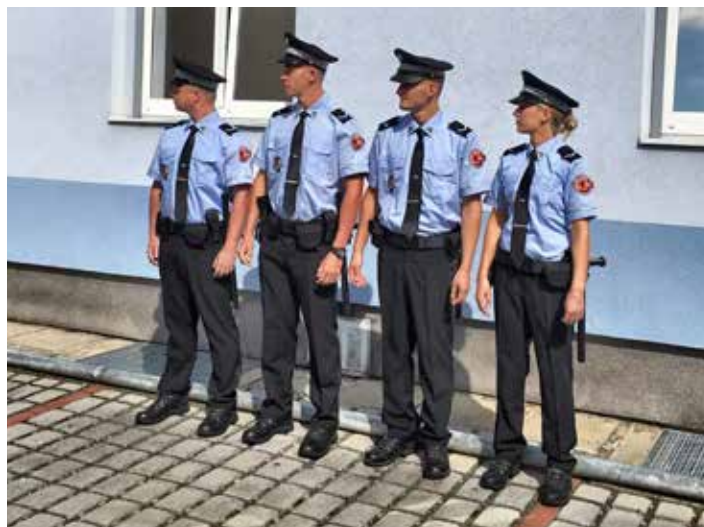
Počet strážníků se zvýšil, celkem jich je zhruba stovka.