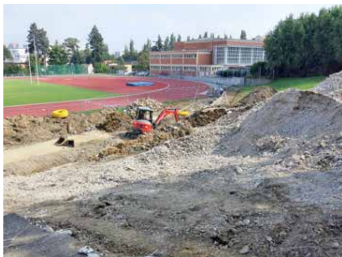
Na původních tribunách se už zub času pořádně projevila. Budují se nové.

Zbrusu nový sportovní areál, rekonstrukce kuchyní a střech, vylepšování vstupu. Budovy škol a školek, které zřizuje město, se během letních prázdnin měnily k lepšímu. Díky investicím v řádu desítek milionů korun.