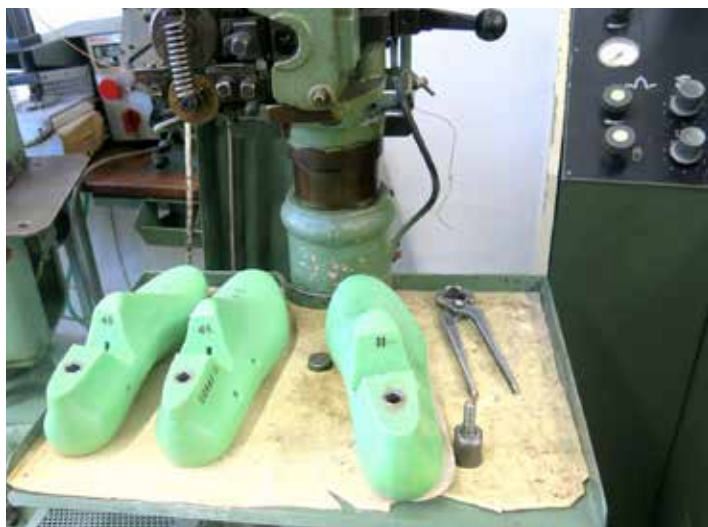
Školní ševcovská dílna.