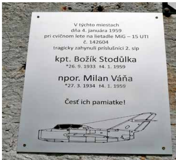
Miesto tragédie pripomína deska.