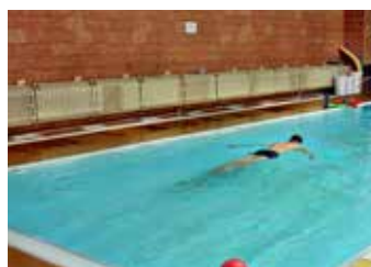
Bazén je i pro veřejnost.