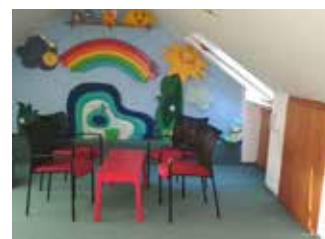
Přívětivé prostředí.

Nová terénní ambulantní „Sociálně aktivizační služby pro rodiny s dětmi“ je službou sociální prevence a přirozeně navazuje na již fungující „Zařízení pro děti vyžadující okamžitou pomoc“ při Dětském centru Zlín, p.o., které poskytuje dětem zázemí a péči v případech, kdy se rodiče po nějakou dobu nemohou o děti starat nebo péči nezvládají. SAS má za úkol napomoci rodinám těmto situacím předcházet nebo alespoň podpořit rodinu v tom, aby umístění dětí mimo domov bylo po co nejkratší dobu. Sociálně aktivizační služby DC Zlín jsou dostupné v celém regionu Zlínska (oblast Otrokovic, Holešova, Luhačovic, Vizovic i Zlína). Jsou poskytovány zdarma, na principu dobrovolnosti, zejména terénní formou v přirozeném prostředí rodin, zázemí pro ambulantní práci je na adrese Dětského centra Burešov ve Zlíně. Blíží informace naleznete na www.dczlin.cz . [red]