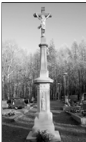
Kříž na hřbitově ve Zlíně - Jaroslavicích.

Prvním z nich byl téměř pětmetrový pískovcový kříž s podstavcem stojící na hřbitově ve Zlíně - Mladcové. Jde o kamenosochařské dílo ze zlínské dílny Františka Smýkala z 20. let 19. století. Kříž se tyčí uprostřed hřbitova a tvoří ho třístupňový podstavec, na kterém je upevněna středová část. Na její přední straně jsou vysekaná