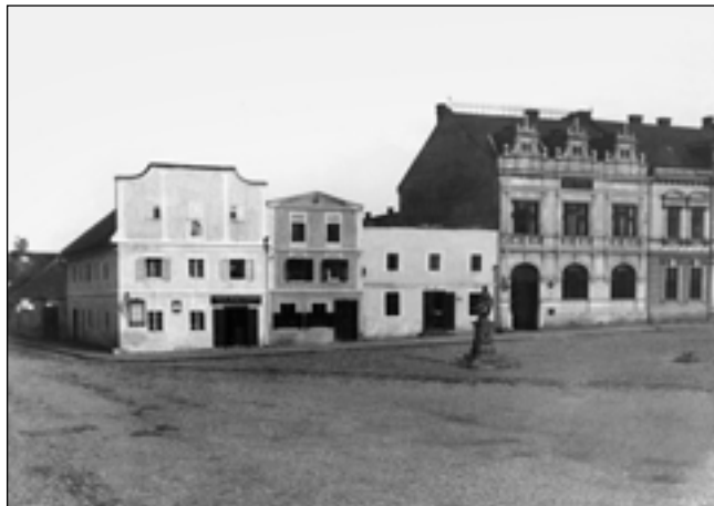
Záložna s okolními domy kolem roku 1900.

Prostor kolem Záložny podél východní fronty náměstí Míru je už několik měsíců velkým staveništěm, před očima se nám proměňuje tato významná část městského centra.