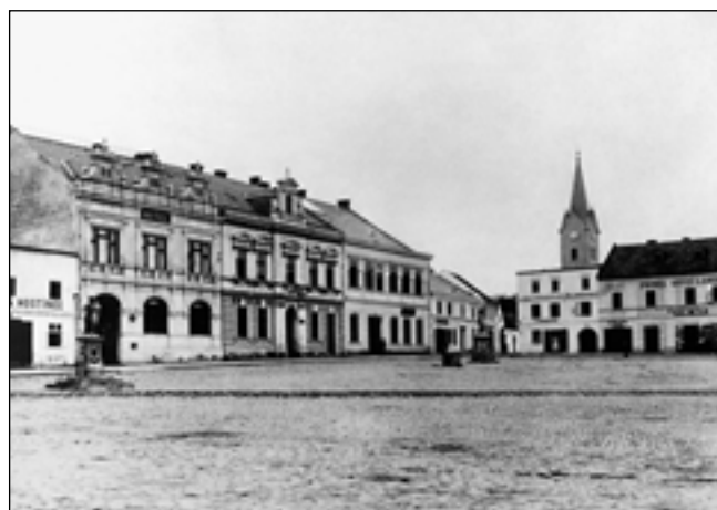
Pohled na náměstí v době před první světovou válkou (r. 1906).

nění do nového komplexu bude připomínat hlubší tradici těchto míst. Při tak dalekosáhlé proměně stojí zato ohlédnout se a přiblížit si, jakou podobu míval tento kout zlínského náměstí.