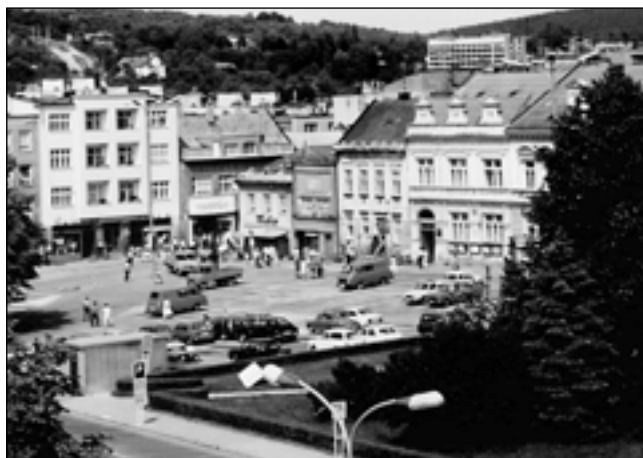
Náměstí Míru v sedmdesátých letech.