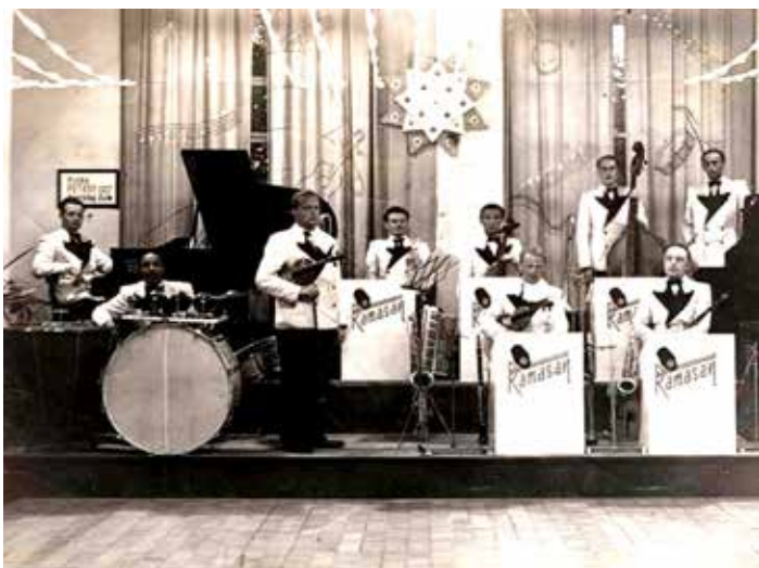
Najde se pamětník, který pozná místo pořízení fotografie?

Takže badatel všem ochotným Zlíňákům děkuje, těm minulým jakož i příštím, a už jim hned slibuje, že v případném třetím pokračování zveřejní naprosto nečekané souvislosti, které spojují dávného zlínského černošského partyzána s dějem filmové legendy Vojtěcha Jasného Všichni dobří rodáci. [red]