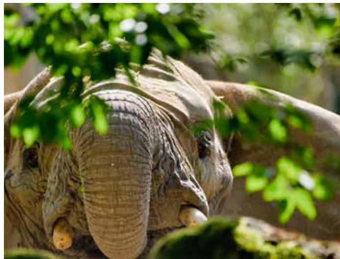
Mezi hlavní lákadla regionu patří zlínská zoo.