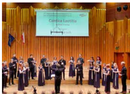
Cantica laetitia Zlín.