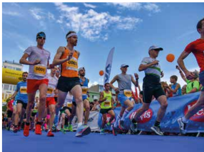
Závod se poběží 1. června příštího roku.

Registrovat se na jednotlivé trať běhu je možné na www.zlinskypulmaraton.cz , kde jsou také