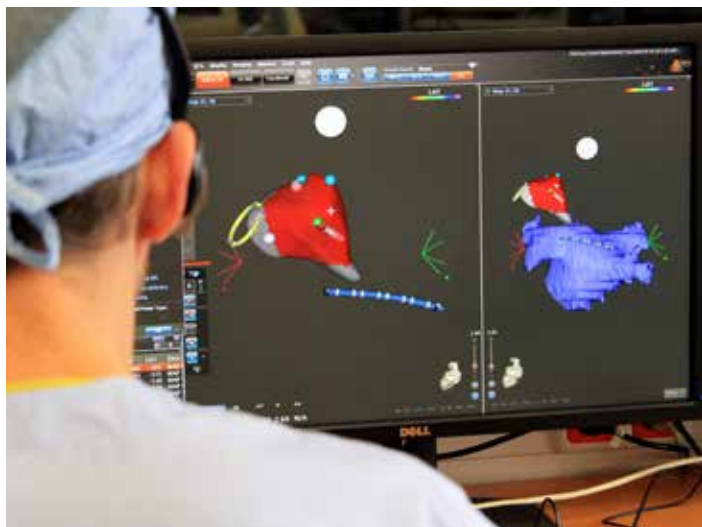
Mapovací systém Carto 3 využívá elektromagnetickou technologii.