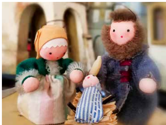
Betlémy jsou jedním ze symbolů Vánoc.

„Na výstavě ve zlínském zámku se vám představí hned několik výrazných betlémářských oblastí. Největší lákadlem je ručně malovaný betlém z roku 1933 od Josefa Václavů z Železnobrodsko, obsahuje 250 figurek. Betlém nebyl nikdy veřejně prezentován, takže ho návštěvníci uvidí v premiéře. Mezi nejrozšířenější betlémy patřily tzv. králické, z Králiků u polských hranic. Výrazná barevnost a velké množství druhů figurek přispěly k jejich popularitě i daleko za hranicemi a dnes jsou ceněnou sběratelskou lahůdkou. Na první pohled vás zaujmou drobnými domečky s červenými věžemi. Zato ty beskydské na výstavě poznáte podle hrubé řezby a také tradičních lidových krojů. Třebíčské malované mají vyso-