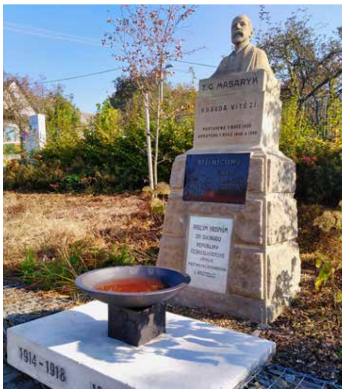
Válečné hroby město postupně obnovuje.

V příštím roce by měl být obnoven kříž na hřbitově v Loukách a na Mladcově. [md]