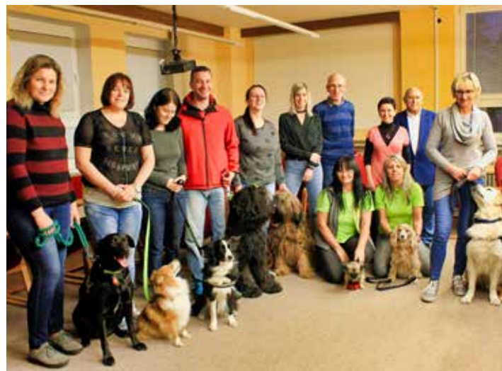
Nemocnice si dobrovolníků a jejich psů velmi považuje.