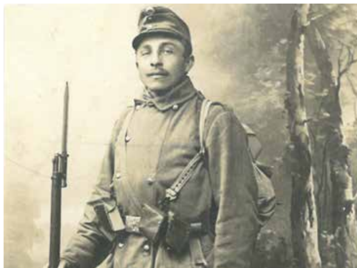
Jana Surého posilovala víra v Boha.

...Jsem ve městě Taškentě, v kasárnách. Je tady veliké horko, na takové není náš člověk zvyklý. Mnoho našich zajatců je zde po-