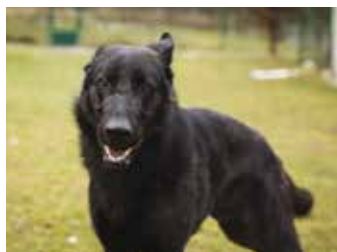
BLESK. / foto: útulek

Na závěr tohoto článku bychom chtěli informovat o provozní době v útulku o vánočních svátcích. V pondělí 24. 12. bude pro veřejnost otevřeno od 13.00 do 15.00, ale nebude probíhat venčení. V pondělí 31. 12. bude zavřeno. Ostatní dny bude otevřeno dle obvyklého zimního režimu.