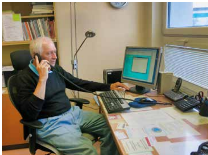
SOS Linka vyžaduje velké pracovní nasazení a empatii.

Nejhorší jsou volání o bezmoci. Kdy se vyskytuje bezmoc na straně volajícího, ale i bezmoc na straně pracovníka linky. Z toho, co slyší, tak cítí, že možnosti pomoci jsou velice omezené, obtíž-