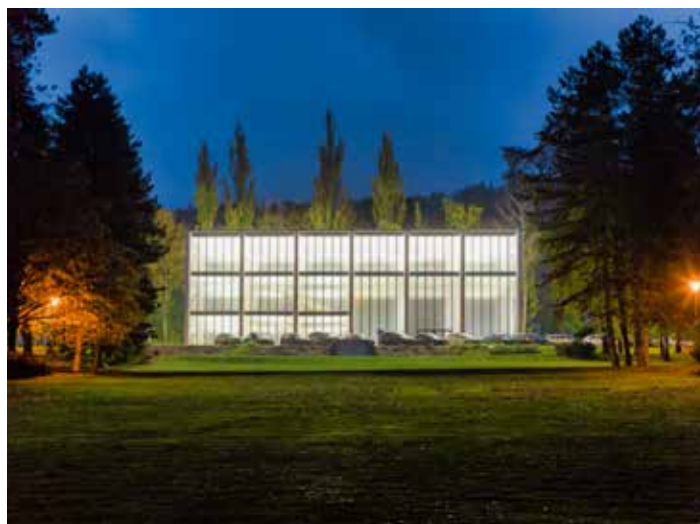
Zářící krystal 27. 10. 2018.