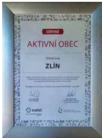
Zlíňané třídí dobře.

ností, ale třídění elektroodpadu, stejně jako dalších méně zastoupených odpadů, stále zaostává a je třeba intenzivně komunikovat přínosy odevzdávání k recyklaci. Během trvání soutěže AKTIVNÍ OBEC byl v zapojených obcích zaznamenán v průměru 10% ná-