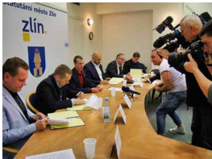
Podpis koaliční smlouvy.