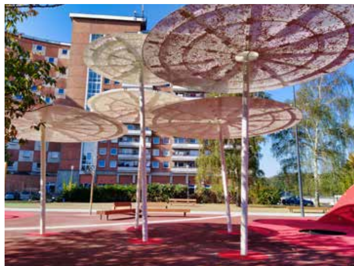
Nové hřiště zaujalo děti i vandaly.

ke svému okolí, tedy k tomu, co nám nepatří. Tady se zatím ukázalo, že vyhrává síla a lhostejnost nad rozumem a slušností,“ doplnila pracovnice Odboru městské zeleně. Po vylomeném kolotoči, uvolněném centrálním herním prvku a škodách ve výsadbách požádal Magistrát města Zlína o spolupráci Městskou policií Zlín, která zde bude dělat preventivní kontroly. Náklady na výstavbu dosáhly částky cca 17 milionů korun bez DPH. Radnice proto apeluje na veřejnost, aby si všimla svého okolí a chovala se slušně a ohleduplně. Vždyť prostranství v majetku města jsou majetkem všech Zlíňanů. Finance, které se musí vyhradit na odstraňování škod a úklid, by bylo jistě možné využít lépe. [fab]