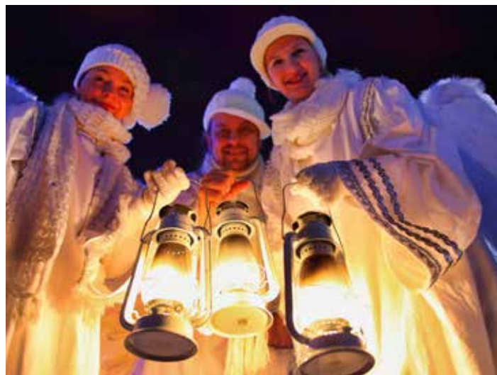
Adventní Zlín bude zahájen v neděli 2. prosince odpoledne.

V sobotu 22. prosince si budete moct odnést betlémské světlo v lucerničce vlastní nebo té „pro Anetku“ a poslední večer protančíme s DJ J. V. Navrátilem na jeho Vánoční Oldies Party. Program i jarmark budou ukončeny v neděli 23. 12. ve 14 hodin. [red]