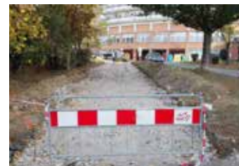
Jižní Svahy propojí stezky.

k tzv. II. segmentu, kde se stezka napojuje již na stávající stezku s odděleným pohybem cyklistů a chodců. Stavební práce začaly budováním smíšené stezky od II. segmentu. Práce přímo v ulici Středová budou zahájeny na jaře. [fab]