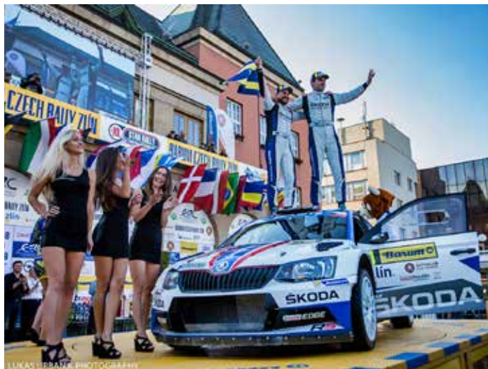
Barum rally má ve Zlíně spoustu příznivců.

Nadcházející ročník populární barumky se bude držet osvědčeného konceptu z předešlých let. Páteční dopoledne bude patřit kvalifikační zkoušce, odpoledne pak v centru Zlína proběhne slavnostní start následovaný večerní speciálkou v nedalekých ulicích. Sobota a neděle pak nabídnou přes dvě stovky kilometrů známých rychlostních zkoušek. „Už nyní intenzivně pracujeme na podobě dalšího ročníku. Jednak bychom se rádi s barumkou a jejími zkouškami podívali na úseky, které by byly zcela nové nebo dlouho nevyužívané, a kromě toho se na mnoha místech po