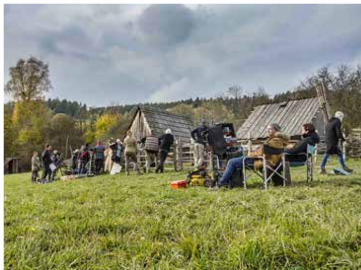
Z natáčení pohádky Hodinářův učeň .

„Část platby využijeme na obnovu vybavení, např. na výměnu větracích šindelů na střeše, popřípadě na doladění autentičtějšího vzhledu v exteriéru. Chceme také pořídit nový informační panel dokumentující historii a územní rozsah salašnictví,“ uvádí Juraj Habšuda , správce Expozice karpatského salašnictví v Hostýnských horách. „Samotné natáčení pro nás sice znamenalo práci navíc, ale současně to byl zajímavý a netradiční zážitek,“ dodává.