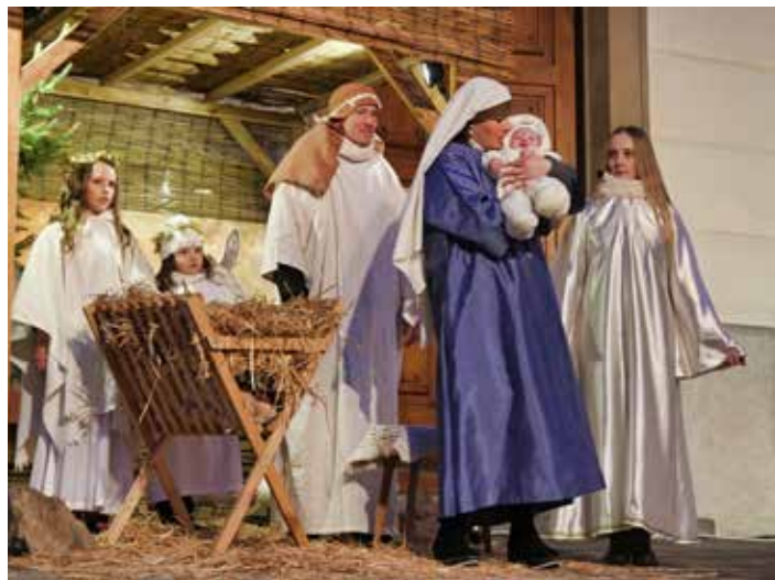
Znovu se zde odehraje příběh o narození Ježíše Krista.

Živý Betlém ve Zlíně pořádá již tradičně Římskokatolická farnost sv. Filipa a Jakuba za podpory statutárního města Zlína. [io]