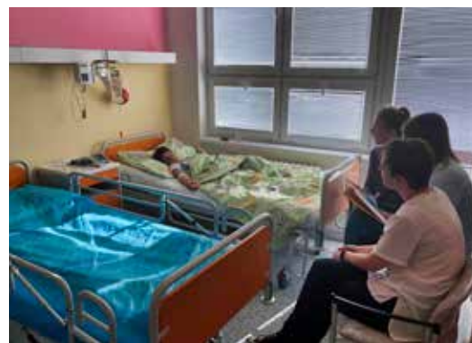
Čtení probíhá dvakrát týdně.