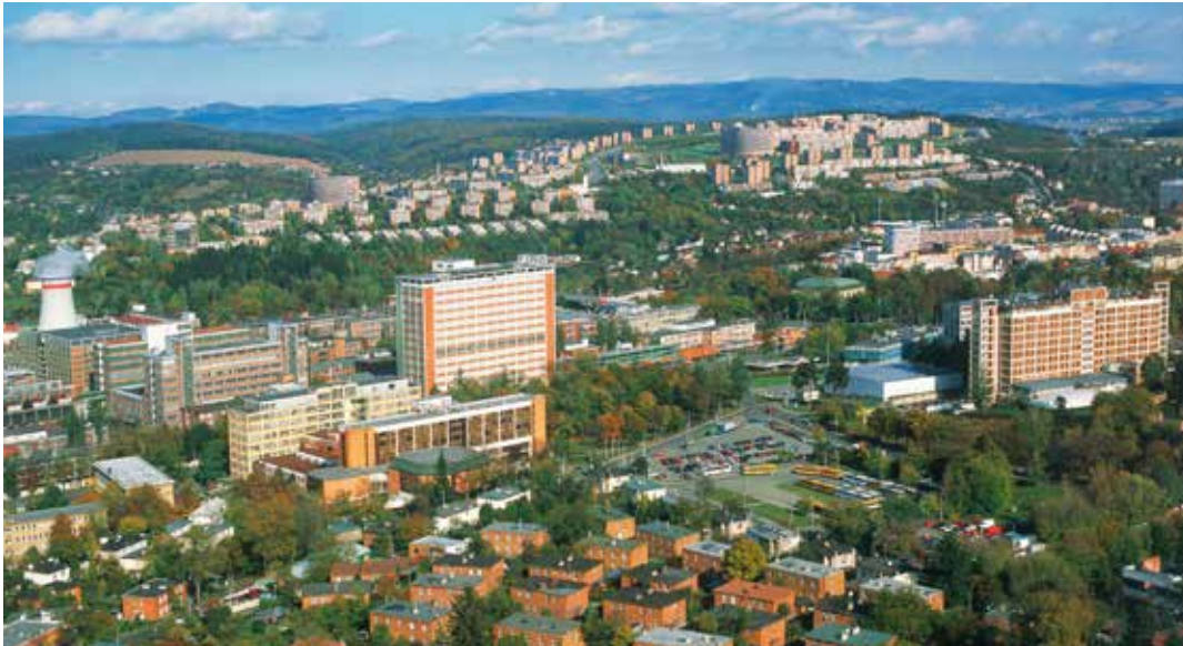
Zlín čekají velké investice.