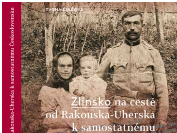
Kniha obsahuje i unikátní fotografie.