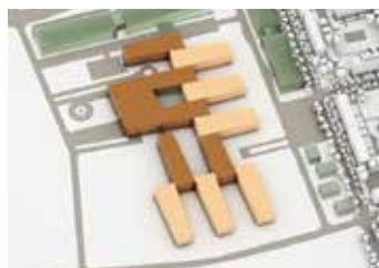
Vizualizace.

daně oproti rekonstrukci současného areálu KNTB, jehož obnova by trvala 12 let a stála by 9,7 miliard korun včetně daně.