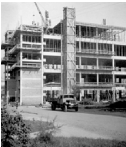
Stavba budovy č. 15, fotografie z jihu ze dne 27. 9. 1946