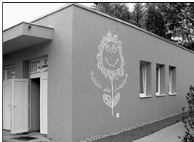
V rámci projektu Energy in Minds! byla rekonstruována i MŠ Santražiny.

Dalším z projektů realizovaných mimo demonstrační oblast byla rekonstrukce MŠ Santražiny. Ta byla realizována za téměř 8 mil. Kč a zahrnovala zateplení obvodových stěn budovy, opravu střechy, výměnu oken a celkovou rekonstrukci systému vytápění, včetně modernizace výměňkové stanice dálkového rozvodu tepla. Věříme, že jak děti, tak i zaměstnanci školky už v současné době pocítují lepší tepelný komfort budovy a že se provozní úspory projeví také ve vyúčtování provozních nákladů za letošní topnou sezonu.