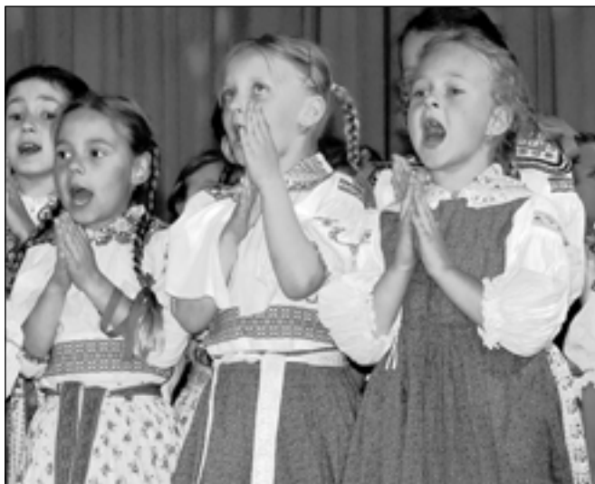
Děti ze souboru Malá Vonica.

Zastoupení hned dvou zlínských souborů na celonárodní přehlídce potvrzuje vysokou úroveň práce s dětmi ve Zlíně. Hodnotící komisi koncepcí pásma Čas zaujala natolik, že Malé Vonici udělila zvláštní uznání. Činnost obou souborů podporuje pravidelně Kulturní fond města Zlína. -red-