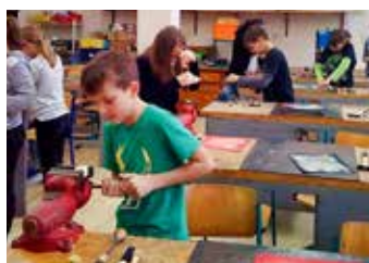
Práce v dílnách.

Ve Zlíně proběhne první ročník netradiční akce - Dětského festivalu řemesel. Akce pro rodiny s dětmi se uskuteční ve Zlínském zámku od 19. do 20. října, od 9.00 do 18.00. Cílem víkendového programu je představit dětem a mladší generaci nejrůznější manuální profese zábavnou formou, prostřednictvím interaktivních workshopů a dílen, zvýšit tak oblibu jednotlivých oborů a ukázat řemesla jako zajímavou činnost s perspektivou do budoucna. Rukodělné dílny doplní prezentace dalších profesí, které jsou v současnosti mimořádně důležité, například IT oborů. Děti si vyzkouší například práce zednické, drátenictví, základy mechanické konstrukce, šití a vyšívání, vaření, obkládání, práci se dřevem, mo-