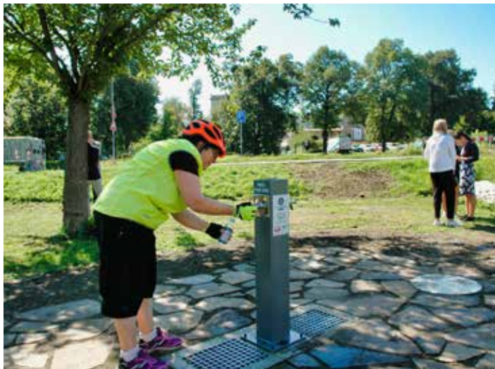
Vodu z pítko už cyklisté ochutnali.

Pítko je umístěno u cyklostezky v parčíku na rohu Sokolské ulice a Fügnerova nábřeží. „Tvoříme Zlín“ je pro nás důležité, jsem proto rád, že se nám podařilo tento společný projekt dotáhnout ještě v letošním roce a může ihned sloužit všem občanům města, nejen cyklistům,“ uvedl Jiří Korec , primátor města. Na realizaci pítko a úpravě jeho okolí se podílelo město Zlín a VaK Zlín. „Tímto počinem také plníme svůj slib, že