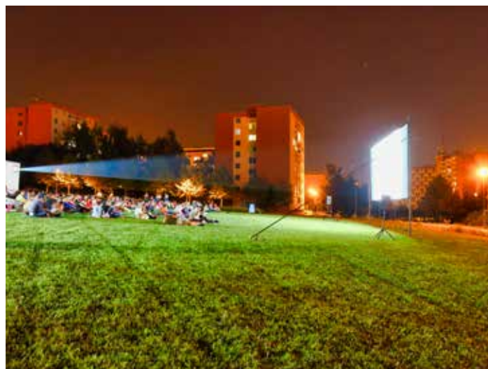
Letní kina jsou ve Zlíně zdarma.