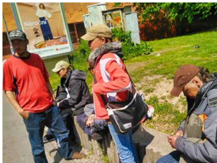
Pokutování nic neřeší, sankce se nedaří vymáhat.

které by bylo možné postihnout. V případech, kdy by docházelo k protiprávnímu jednání ze strany těchto osob, je strážník povinen zakročít. Může se jednat například o skutečnosti narušující veřejný pořádek dle § 5 zák. č. 251/2016 Sb. o některých přestupcích (neuposlechnou výzvy úřední osoby při výkonu její pravomoci, poruší noční klid, vzbudí veřejné pohoršení, znečistí veřejné prostranství, veřejně přístupný objekt nebo veřejně prospěšné zařízení).