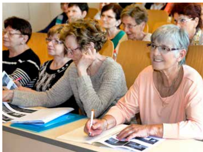
Univerzita třetího věku vychází ze zájmů seniorů.

Témata, která nabídne Univerzita třetího věku v novém akademickém roce seniorům ve Zlíně a v okolí, vycházejí z jejich vlastních požadavků a oblastí jejich zájmů. Již tradičně se pozornost seniorů soustřeďuje na téma zdraví. Největší zájem totiž projeví o kurz, jehož motto zní: „Dožít se svatby svých právnicků.“