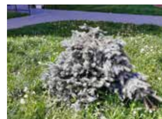
Polámaný jehličnan.

Právě teď v období od října do konce listopadu bude Odbor městské zeleně vysazovat téměř čtyři stovky nových stromů. Kolik z nich však opět nepřežije řádění vandalů, kteří při svém omezeném rozhledu ani netuší, že vlastně škodí sami sobě, je otázkou. [fab]