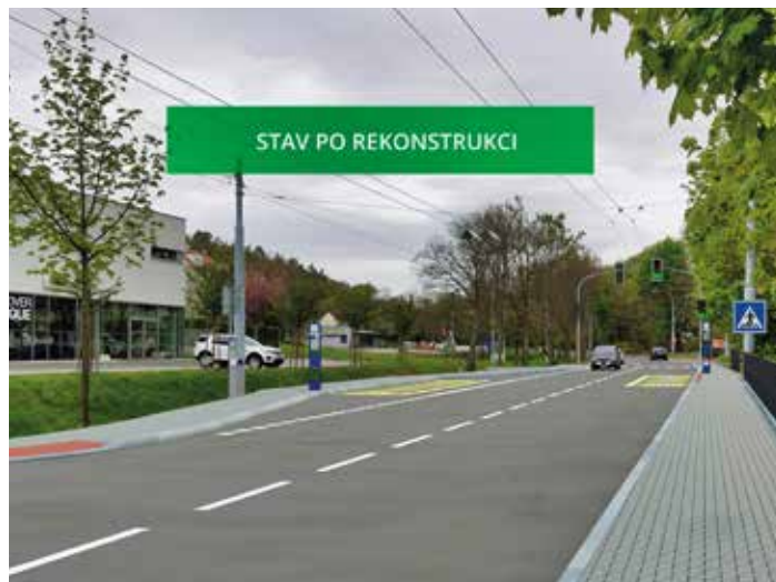
Poslední etapa začala v září. / foto: vizualizace

Ne ve všech sběrných dvorech je přitom možné uložit jakýkoliv odpad. Proto je vhodné se před návštěvou předem informovat na stránkách Technických služeb Zlín www.tszlin.cz/ukladani-odpadu/sberne-dvory . [jjn]