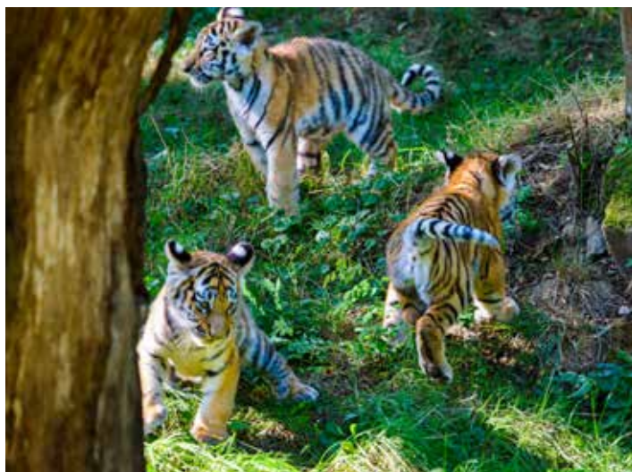
Výjimečně v akci. Většinu dne kořata prospí.

Tygří ussurijští se ve zlínské zoo poprvé objevili v roce 1968. Novodobá historie chovu začala s příchodem samice Tanji z ruské Zoo Čeljabinsk v roce 2005. Doposud se stala matkou čtyřikrát, včetně těch letošních odchovů 11 mláďat. Otcem Samby, Umy a Nanu je samec Boatsman, kterého má zlínská zoo zapůjčeného z estonské Zoo Talin. Tygřiči jsou ve skvělé kondici, každý den neúnavně prozkoumávají rozlehlejší výběh. Prozatím jsou zcela závislí na mateřském mléce, pomalu však začínají ochutnávat i maso. [rb]