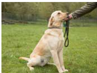
TIMMY.

DENIS – kříženec špice, 6 let, vhodný na zahradu, má rád pravidelné výlety