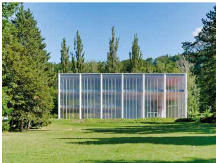
Unikát má za sebou první sezonu.

Při návštěvě Památníku se přichozím v infopointu Památníku dostane profesionálního servisu ze strany odborně školeného personálu. Komentovanou prohlídku budovy zajišťují kvalifikovaní zkušení průvodci vybavení několika světovými jazyky. Zájemci si mohou zdarma na památku odnést tiskoviny a brožury, zhlédnout krátké edukativní spoty nebo si zakoupit propagační předměty – nechybí mezi nimi ani oblíbené turistické známky a vizitky. Novinkou v sortimentu