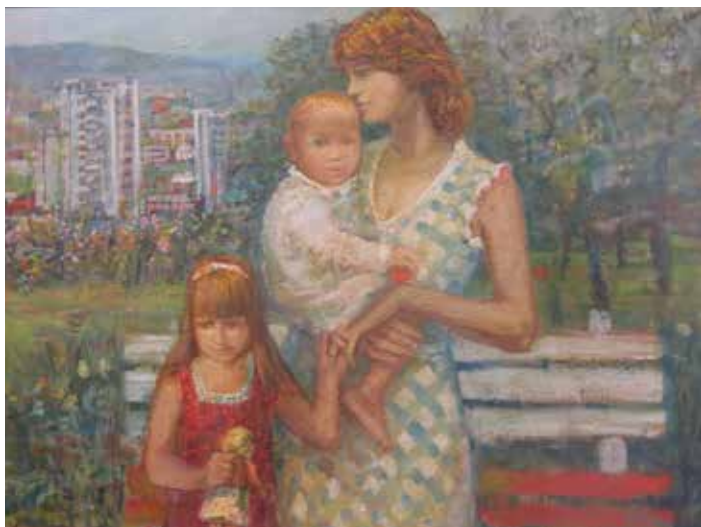
Výstava připomene nedožitých 80 let malíře.