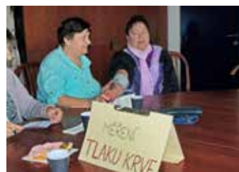
Akce podporuje město.