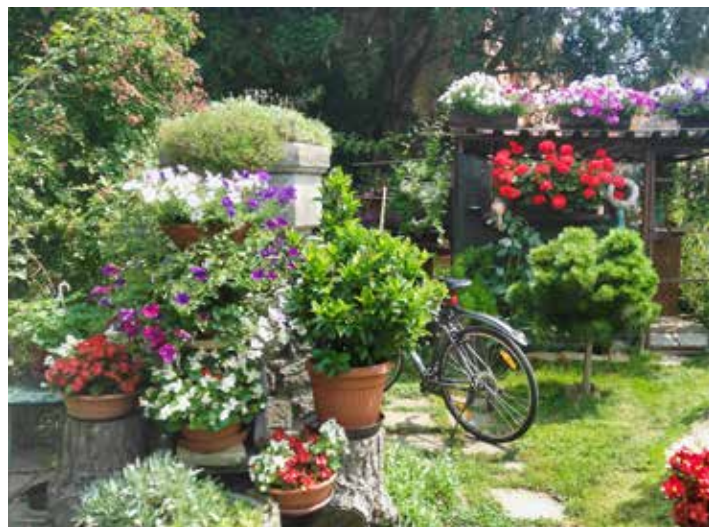
Předzahrádka RD Jany Matulové.