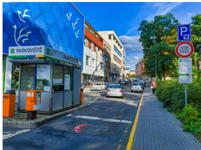
Cílem je, aby auta ve městě neparkovala dlouho a uvolnila místo dalším.

„Zavádíme roční zvýhodněné rezidentní stání pro občany, kteří si budou moci za velmi výhodných podmínek koupit roční parkovací kupon a budou tak moci parkovat na své ulici, kde mají trvalé bydliště. Ovšem bez garance parkovacího místa. Výhodou však pro ně je, že mohou parkovat u svého domu, bez starostí o placení parkovného. Nemusí vybíhat ven a prodlužovat si dobu parkování. Jde o nejrychlejší krok, který nyní můžeme udělat, abychom zvýhodnili rezidenty oproti ostatním,“ přiblížil radní pro dopravu. Rezidentní ulice ve městě jsou téměř všechny, kde je parkovací automat, výjimku tvoří ulice Hradská. „Také chystáme pilotní projekt - modré zóny ulice Sado-