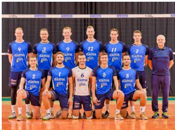
Týmové foto extraligových volejbalistů.

zlepšení výkonu. Jak jsem říkal, loňská sezona nebyla vůbec podle našich představ.