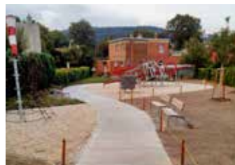
Hřiště po rekonstrukci.

Od 2. září 2019 už začalo veřejnosti, a především dětem, sloužit nově zrekonstruované hřiště č. 101 ve Zlínské části Zálešná. Hřiště se nachází v zastavěném území rodinných Baťových domků v památkové zóně. Na hřišti byly dosud dva nevyhovující herní prvky a dvě lavičky.