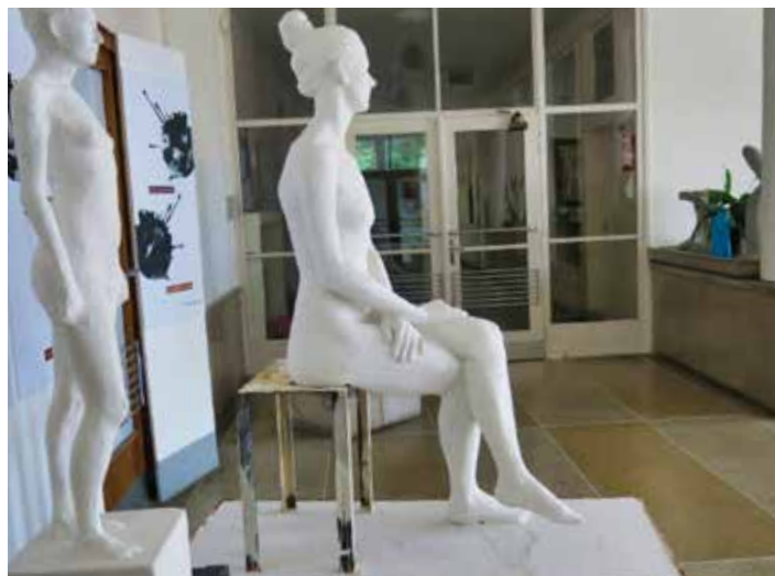
Studentská práce Oboru sochařství. / foto: I. Orságová

Začátky byly hodně krušné. Několikrát jsme měli obavy, zda to vůbec finančně ustojíme, a stáli před úvahou, jak školu udržet. Obzvláště ze začátku, kdy jsme měli pouze jeden ročník herců a jeden ročník výtvarníků, tedy než se naplnily tři ročníky. Velice nám pomohlo dostat se z finančních problémů, že nám město umožnilo působit ve Vavrečkově vile za netržní nájem.