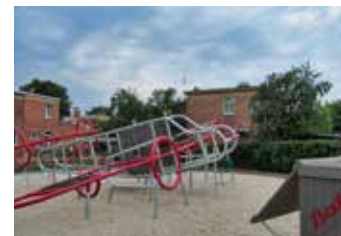
Model letadla Lockheed.