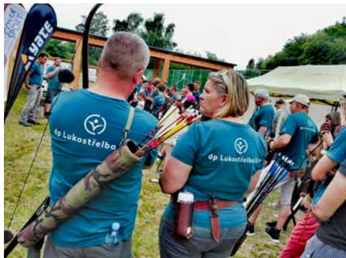
3D lukostřelba je mladý sport se starými loveckými kořeny.