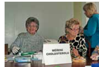
Lidé si zkontrolují zdraví.

Vysvětlivky: * Podpořeno statutárním městem Zlínem