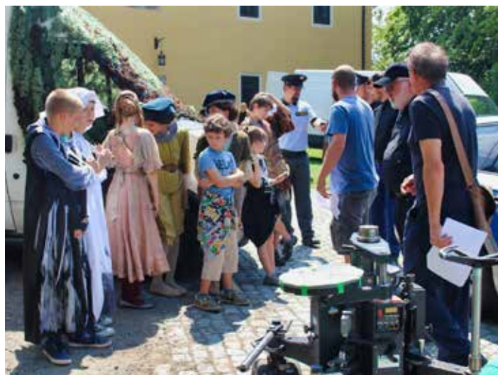
Zlín znovu ožívá filmovou tvorbou.

Společnost Teplo Zlín je tak připravena na zahájení topné sezony. Ta legislativně začíná 1. září, faktické zahájení dodávek tepla ale vyhláška nařizuje až tehdy, pokud teplota ve dvou po sobě následujících dnech poklesne pod 13 °C a podle předpovědi nelze očekávat její zvýšení v dalším dnu. Směrodatná denní teplota se přitom získává průměrem z několika měření během dne. Topná sezona oficiálně končí 31. května. [jjn]