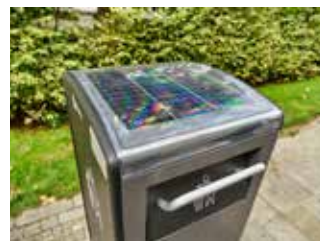
Koš má solární panel.

Po celém městě byste jich napočítali bezmála 1100. Řeč je o koších na odpady. Přesto, že každý z nich je vyvážen minimálně dvakrát či třikrát týdně – a některé dokonce i několikrát denně – nastávají situace, kdy koš je přeplněn. Pomocí s řešením těchto situací by mohla i speciální nádoba s lisem. Jedna taková byla v září Technickými službami Zlín zkušebně instalována v parku Komenšského, poblíž budovy bývalé krajské knihovny.