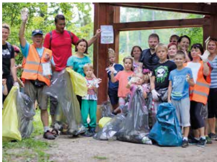
Lidi, kteří nezištně zlepšují své okolí, je potřeba si vážit.

města uspořádal spolek Letná žije. Odpoledne mělo být nejen zábavné, ale také užitečné, a to pře-