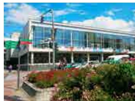
Představení divadla lákají.

Pokud bychom si pohráli s čísly za loňský rok a podělili celkovou výši dotací z města (111 290 000 korun) celkovým počtem návštěvníků (787 290 lidí), zjistíme, že na zábavu a příjemně strávený volný čas každého z nich město přispělo částkou cca 141 korun. Je to hodně nebo málo?