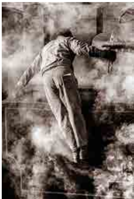
1. - 2. místo - Baletka

Ve dnech 25. srpna až 6. září bude možné v prostorách Alternativy spatřit více než sto zajímavých fotografií. Zlínský fotoklub Okamžiky vystaví Přehlídku nejúspěšnějších prací z 52. ročníku Českobudějovického mapového okruhu a výstavu souboru fotografií zlínského fotoklubu nazvaného Inkognito. První z výstav představí mezinárodní fotografickou soutěž fotoklubů, jejíž čeští a slovenští účastníci si během roku vyměňují své kolekce fotografií (tzv. „mapy“). Poté se na závěr ročníku setkávají k závěrečnému vyhodnocení. To se letos koná 6. září od 14.00 právě v Alternativě. Fotografické mapové okruhy mají v českých zemích více