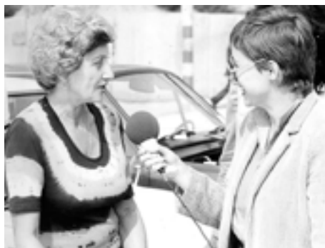
Z činnosti AMK Zlíňačka.