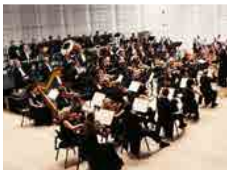
O koncerty FBM je zájem.

Z hlediska výše dotace na provoz je největším příjemcem divadlo, které v roce 2013 dostalo téměř 40 milionů korun. Zhruba o deset milionů korun méně poslalo město hokejistům. Zde jsou však příjemci dva: PSG Zlín s.r.o., která provozuje mužskou extraligu, a HC PSG Zlín, o.s., které se stará o sportování dětí a mládeže a vlastní stadion Luďka Čajky. Nejmenší dotaci na provoz dostala od svého zřizovatele zoo, šlo o částku cca 19 milionů korun.