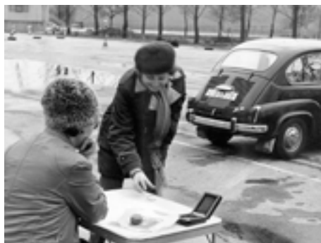
Z činnosti AMK Zlíňačka.

mělé a vlastní řidičský průkaz, aby se mohly scházet, sdělovat si navzájem své zkušenosti a provádět svépomocí údržbu auta. „Na výzvu v tisku se začaly přihlašovat ženy-řidičky, které byly bez partnera a chtěly se zdokonalovat v samostatné jízdě za kaž-