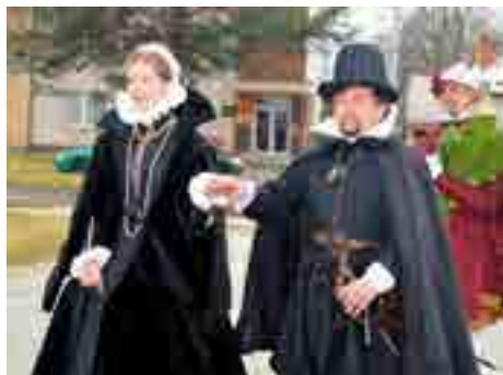
Letošek je ve znamení Lukrecie.