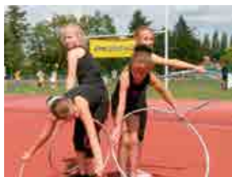
Podporu dostal i Den sportů.