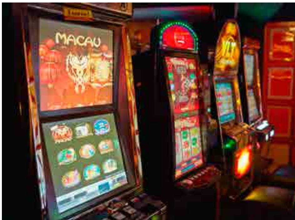
Podle výsledků anket se zdá, že pro Zlíňany není hazard palčivým tématem.