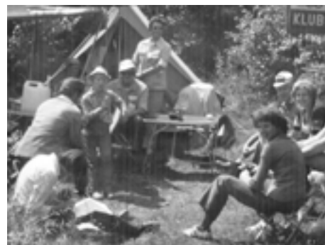
Z činnosti AMK Zlíňačka.