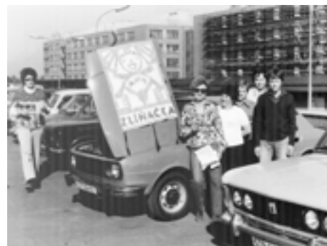
Z činnosti AMK Zlíňačka.