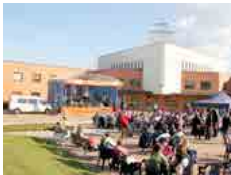
Festival má své návštěvníky.