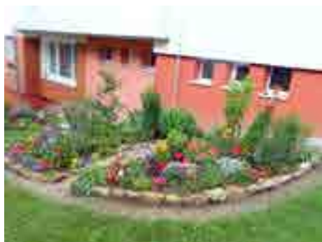
Jedno z prvních míst v kategorii I B.