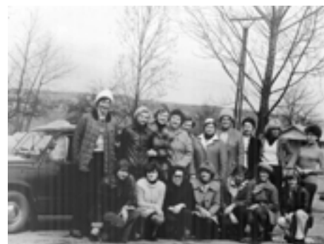
Z činnosti AMK Zlíňačka.