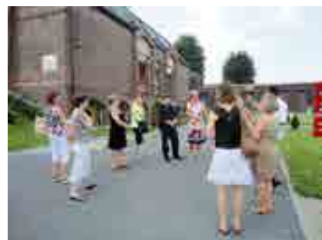
Návštěva se vydařila.

noclehárnu pro muže bez domova, Středisko pro podporu rodiny (pro děti vyžadující náhradní celodenní péči), Celodenní středisko sociální pomoci pro seniory – Caritas, Centrum sociálních iniciativ a Středisko denního pobytu pro osoby postižené demencí včetně postižených Alzheimerovou chorobou,“ uvedla vedoucí odboru sociálních věcí Jana Pobořilová . Účastníky cesty velmi mile překvapil vřelý lidský přístup personálu k uživatelům služeb a rovněž i to, že jejich zřizovatelé a provozovatelé jsou schopni pružně reagovat na potřeby klientů. [red]