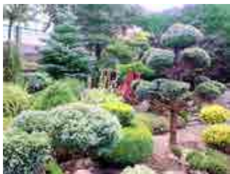
1. místo v kategorii I A.