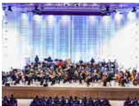
Filharmonie je na vzestupu.

V naší první sezoně v novém Kongresovém centru jsme měli průměrnou návštěvnost 611 posluchačů, což byl velký nárůst oproti návštěvnosti koncertů v Domě umění, kam si průměrně našlo cestu 431 posluchačů. Ve druhém roce činil průměr 655 a poslední sezonu dokonce 686 posluchačů.