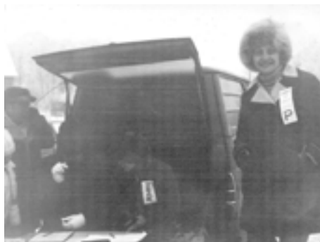
Z činnosti AMK Zlíňačka.