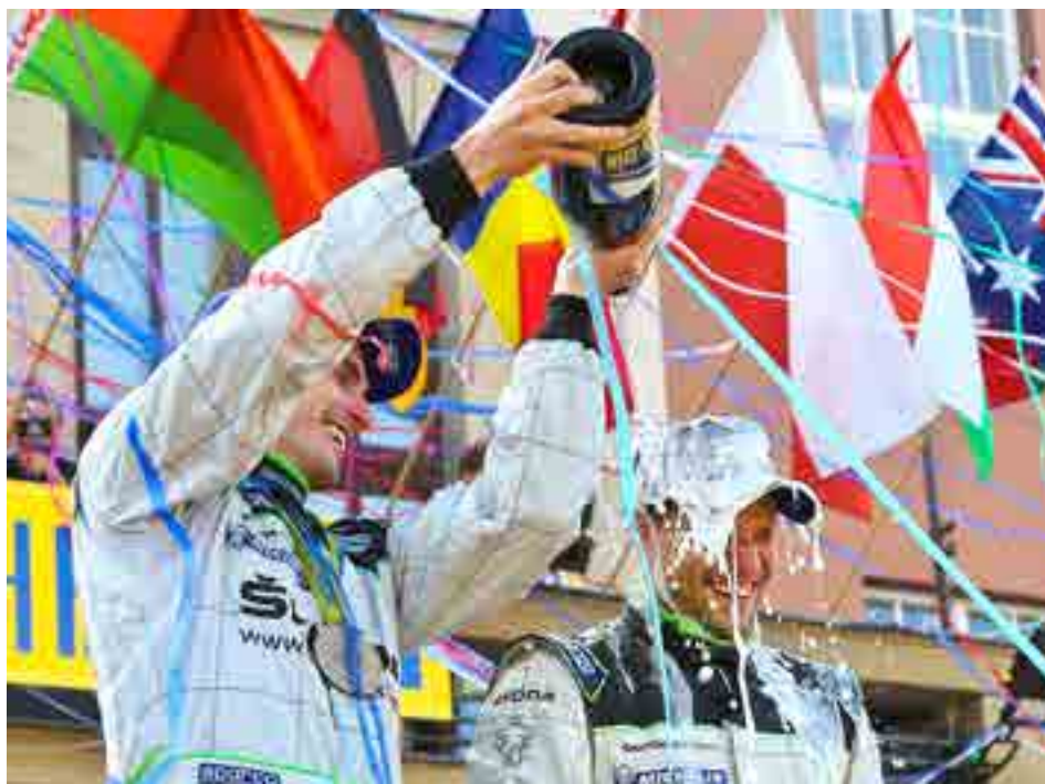
Jan Kopecký letos prvenství obhajovat nebude.