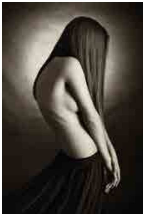
1. - 2. místo - S ako súmrak.

Výstava Soubor Inkognito představuje kolekci fotografií, na nichž nelze úplně a s určitostí identifikovat fotografované osoby. Členové fotoklubu Okamžiky reagují na legislativní omezení spojená s fotografováním lidí na veřejnosti a zároveň se zamýšlejí nad otázkou, jak asi bude vypadat živá fotografie v budoucnosti, kdy postupně budou vstupovat