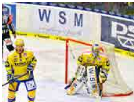
Hokej zažívá sportovně skvělé časy.

Dotace na provoz nejsou jedinými penězi, které jmenované společnosti od města dostávají. To podporuje také jejich investiční záměry, které pomáhají zkvalitňovat podmínky pro návštěvníky či nabídku programu. Například 25 milionů korun radnice pomohla s výstavbou unikátní Zátoky rejnoků, která bude otevřena už v září. Rovným milionem korun pomohlo město