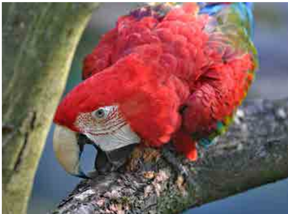
Zoo má nejvyšší návštěvnost.

111 290 000 korun. Tak přesně tuto částku loni poslalo město Zlín na provoz čtyřem významným organizacím, které zřizuje nebo v nich má podstatný majetkový podíl. Jedná se o Městské divadlo, Zoo a zámek Lešná, Filharmonii Bohuslava Martinů a zlínský hokejový klub.