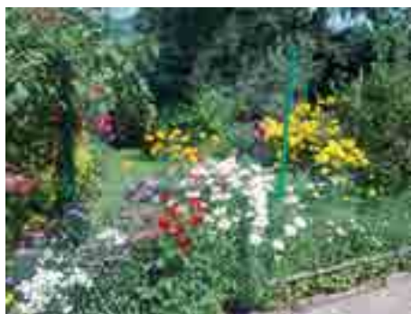
Jedno z prvních míst v kategorii III.

Slavnostní vyhlášení vítězů XVIII. ročníku soutěže Rozkvetlé město se uskuteční 18. září v 16.00 v prostorách kulturního institutu Alternativa. Věcným darem od sponzorů budou oceněni všichni účastníci soutěže. Součástí slavnostního odpoledne budou přednášky na odborná zahradnická témata.