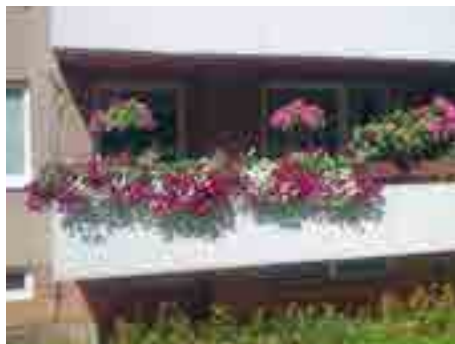
Jedno z prvních míst v kategorii II. / foto: MMZ