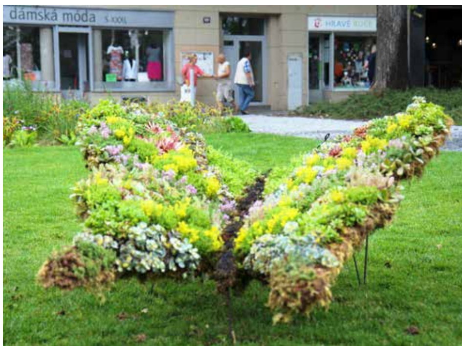
Park Komenského zdobí další floristický objekt.

Floristické předměty se staly ve Zlíně už tradicí. V loňském roce například ozdobilo park Komenského dílo nazvané Snoubení komunity s přírodou, které mělo podobu Ženy vyrůstající ze zeleně. Motivem bylo sdílet, že příroda a lidé patří k sobě. [dvo]