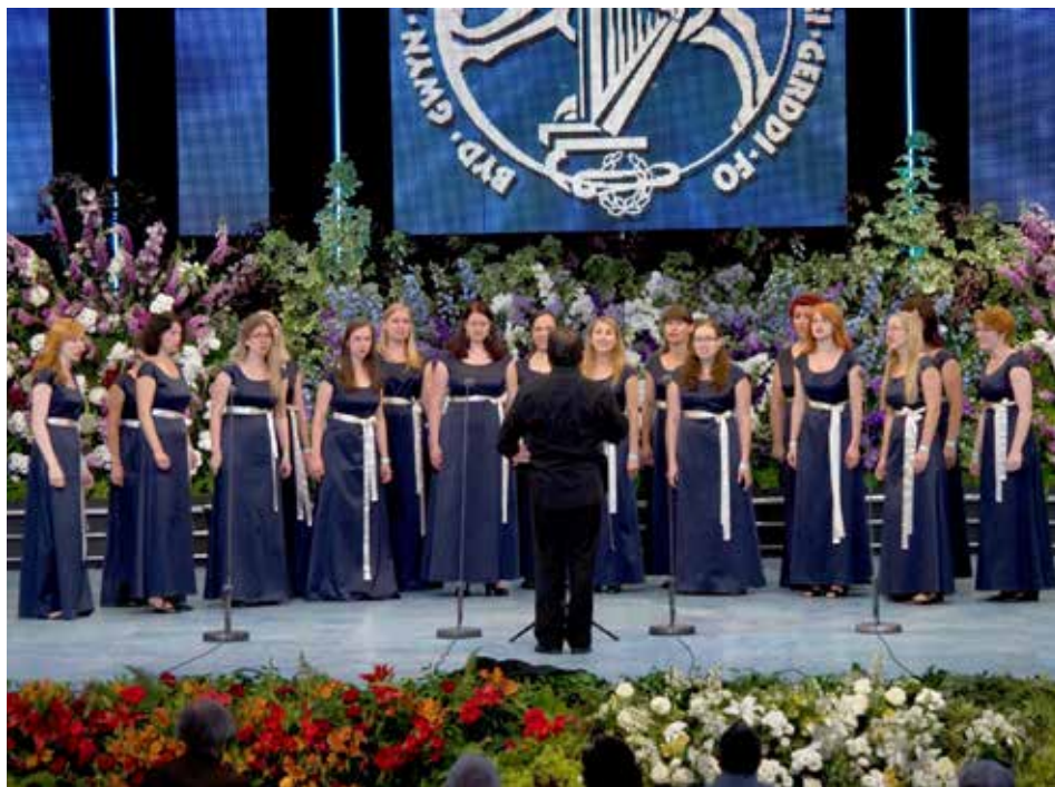
Cantica laetitia patří mezi velmi úspěšné soubory.