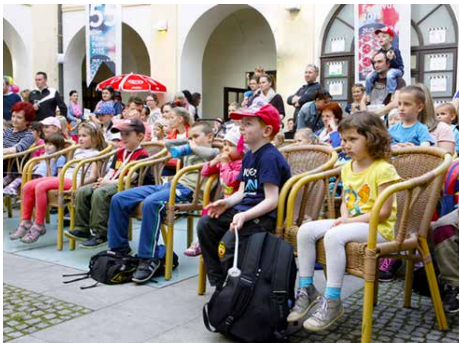
Nádvoří zámku ožije projekcemi filmů zlínských tvůrců.