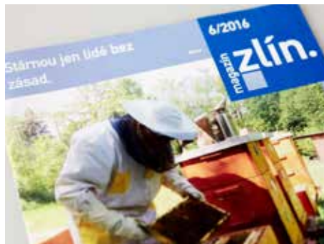
Magazín Zlín.

Oddělení tiskové patří k nejmladším oddělením na magistrátu. Vzniklo odloučením části agendy začleněné do oddělení cestovního ruchu vnitřních a vnějších vztahů v polovině roku 2014. Jeho chod zajišťují tři pracovníci, z toho jeden pracovník zastává pozici tiskového mluvčího a šéfredaktora Magazínu Zlín.