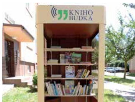
Knihobudka v Malenovicích.

nebo kontaktovat organizátory e-mailem knihovnaprovas@seznam.cz . Více na adrese www.knihobudka.cz/mapa . [io]