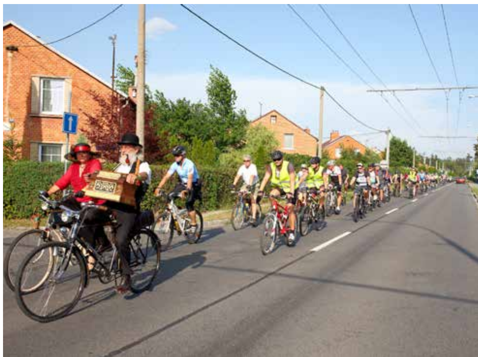
Cyklojízdy pořádané městem si rychle našly své příznivce.