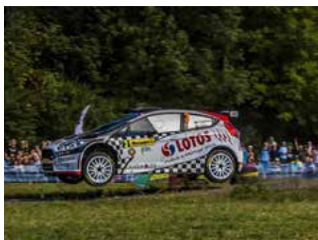
Rally je divácky atraktivní.

Mimořádnou podívanou slibují i doprovodné akce jako IX. Star Rally Historic 2016 (letos poprvé v rámci Autoklub Mistrovství České republiky v rally historických automobilů) nebo Grand Prix Bugatti. [tz]