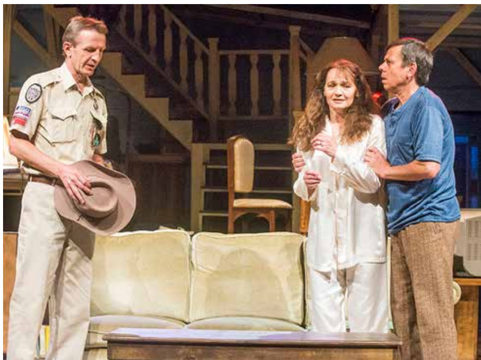
Městské divadlo se pečlivě chystá na novou sezonu.