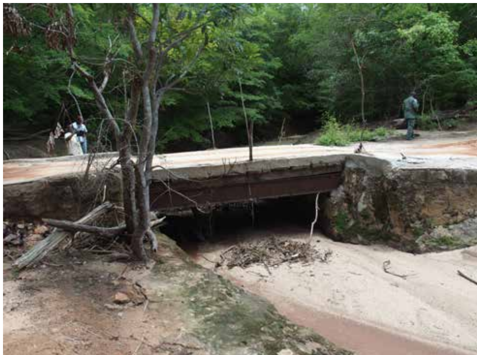
Zoo Zlín pomůže s obnovou rezervace.

Prováděná vyšetření naznačují, že by sloní samice ze Zlína mít potomky mohly. „Přesto to s jistotou říci nemůžeme. Pravděpodobnost, že inseminace bude úspěšná, je přibližně padesátiprocentní,“ upozornil Roman Horský, ředitel zoologické zahrady. Mláďata slonů přicházejí na svět po březosti trvající 22 měsíců. Novorozené sluně měří na výšku téměř 100 cm a váží asi 100 kg. Zajímavé je, že k sání mateřského mléka nepoužívá chobot, ale pije přímo tlamou. Matka jej kojí dva roky. Když je sluně napadeno, urputně jej brání. Do Zlína byly slonice přivezeny v dubnu 2003 z Jihoafrické republiky. Pocházejí z Krügerova národního parku, z regulačního odchytu slonů. Shodou okolností to byli poslední savci tohoto druhu, u kterých bylo vydáno povolení na převoz do jiné země. Sloninec, jak se chovné zařízení pro slony nazývá, bude součástí první etapy Karibuni. Rozkládat se bude na pěti až šesti hektarech, bude tak jedním z největších svého druhu v Evropě. Umožní chov až osmi afrických slonů. Náklady na vybudování dosáhnou v aktuální první etapě výše 70 milionů korun, z nich 60 poskytne ze svého rozpočtu město Zlín, zbylých 10 uvolní Zlínský kraj. Výhledově bude kompletní výstavba celého sloniho areálu stát 175 až 200 milionů korun. [dvo]