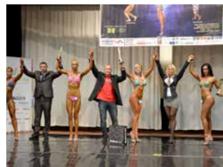
Přišly i zlaté medaile.

Momentálně jsem v přípravě na podzimní sezonu. Už mám od závodů pět kilogramů nahoře a ještě potřebuji další nabrat. Dobu na přípravu mám teď krátkou, o to víc tak musím zabrat. Jsem teď v posilovně až 8 hodin denně. Ale ne jen kvůli cvičení, je to i má práce. S manželem jsme si otevřeli posilovnu Ultimate Gym. A co se týká závodů, tak těmi nejdůležitějšími pro mě bude listopadové mistrovství světa v irském Dublinu. [dvo]