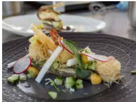
Festival nabídne skvělé jídlo a pití.

Garden Food Festival je regionálním festivalem dobrého jídla a pití, jenž není svázán žádnými hranicemi. Jeho druhý olomoucký ročník navštívilo během víkendu na 15 tisíc návštěvníků. Projekt si klade za cíl dlouhodobě ukazovat široké veřejnosti ve městě, kraji i v celé republice, že v daném regionu je řada kvalitních restaurací a kuchařů, kteří dělají svoji práci s radostí a dobře. Projekt podporuje místní výrobce a farmáře, regionální potraviny a značky, cestovní ruch ve městě i kraji, propaguje gastro-turistiku. Současně přináší nové trendy v gastronomii, ukazuje zajímavé koncepty, přivádí špičkové kuchaře. Více informací, foto a videa z předchozích ročníků najdete na www.gardenfoodfestival.cz . [km]