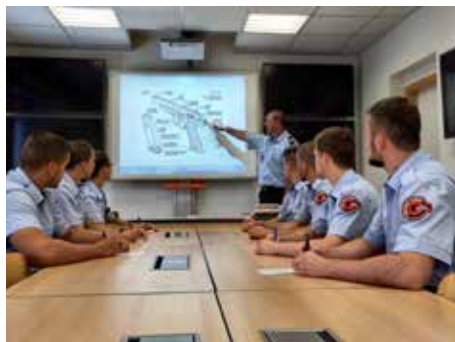
Role městské policie je důležitá.