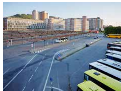
Nádraží je méně bezpečné.