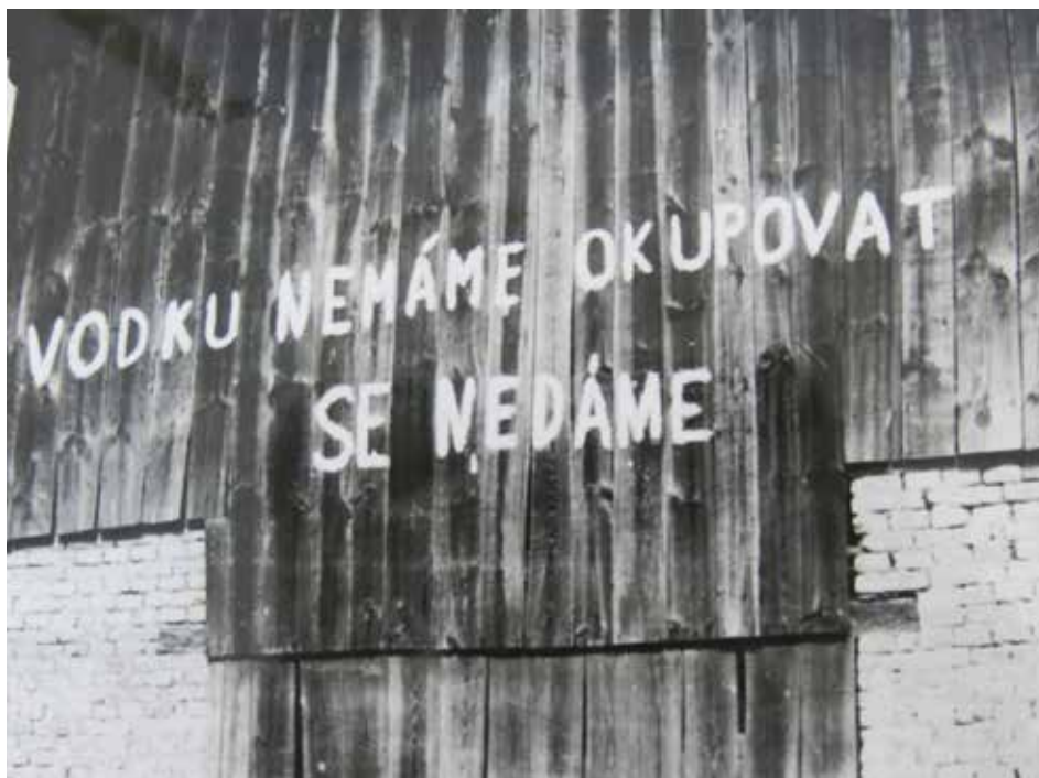
Nápisům a vzkazům pro vojáky, i přes vážnost situace, nechyběl humor.