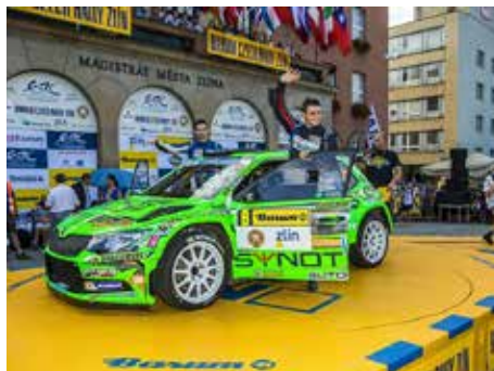
Start bude opět na náměstí Míru.

Předehrou samotné rally bude během pátečního dopoledne od 9:15 hodin opět kvalifikační zkouška pro jezdce s prioritou FIA a ERC na úseku Pohořelice v délce 4,71 km. „Na základě výsledků si jezdci vyberou v pátečním odpolední od 15:30