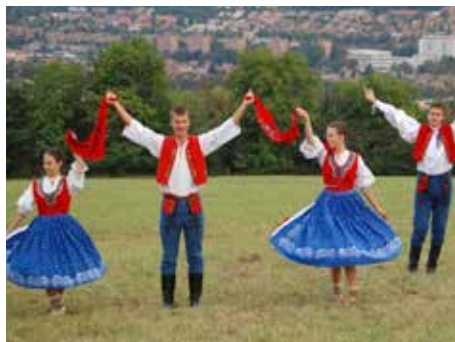
Bartošův soubor funguje od roku 1952.

Bartoš se už od gymnázia věnoval českému jazyku, byl součástí skupin literátů