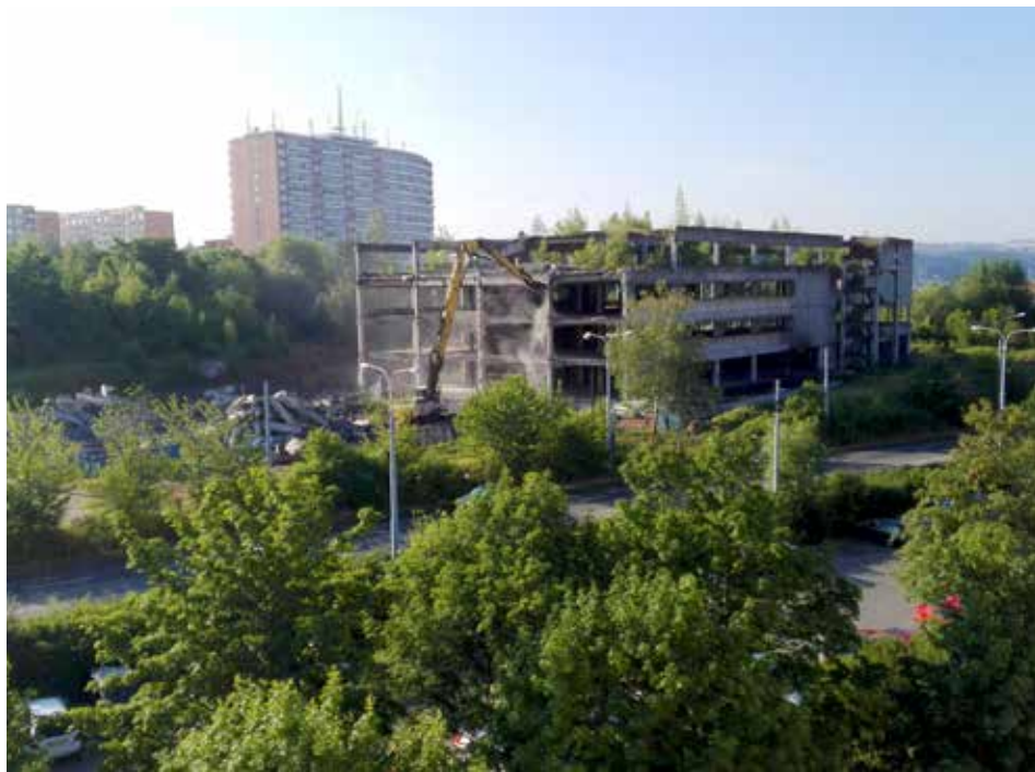
Samotné bourací práce trvaly pouze pár týdnů.