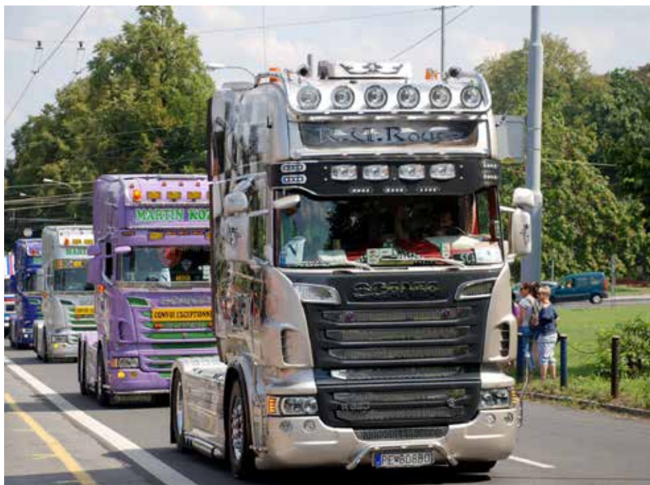
Pohled na silné trucky je atraktivní. Líbí se dětem i dospělým.