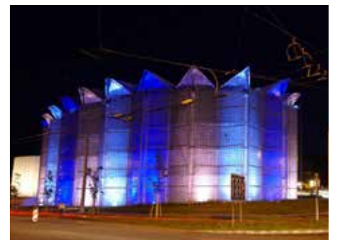
Kongresové centrum hledá šéfa.

lidí, což výrazně překročilo předpoklad. Vyšší oproti plánu (13,2 milionu korun) byly i provozní příjmy – 14,4 milionu korun. Výdaje měly dle plánu dosáhnout výše 20,2 milionu korun, v realu však nakonec stačilo pouze necelých 17 milionů korun. [dvo]