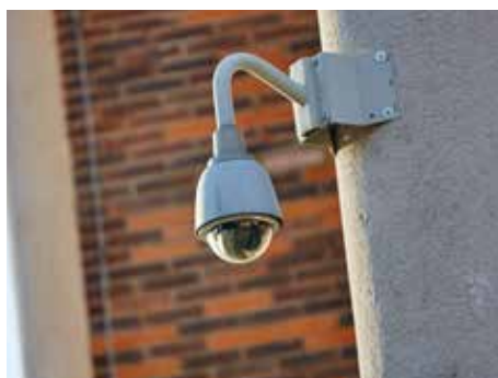
Kamerový systém je účinný.