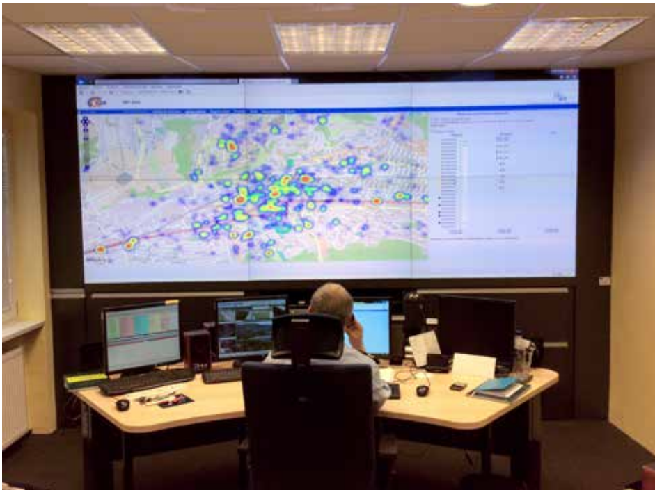
Obraz z kamer ve školách a školkách se přenáší na monitorovací pult městské policie.