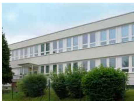
Budova má novou fasádu.

Zateplení, nová fasáda, výměna oken a oprava střechy. Takovým rozsahem oprav prošla budova Střediska volného času – Ostrov radosti na Kotěrově ulici.