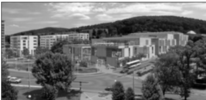
Vizualizace společensko-obchodního centra Kaskáda.