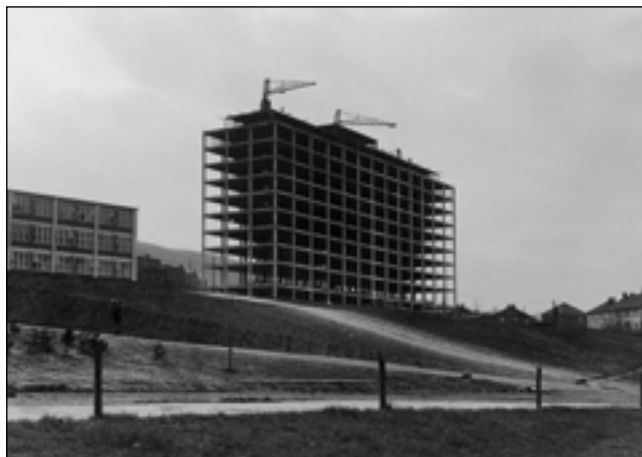
Rozestavěný hotel