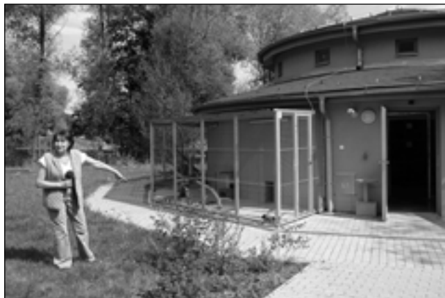
Zpěvačka Marta Kubišová při natáčení pořadu Chcete mě ve zlínském útulku.