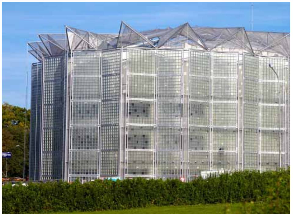
Některé dotazy směřovaly k financování stavby Kongresového centra