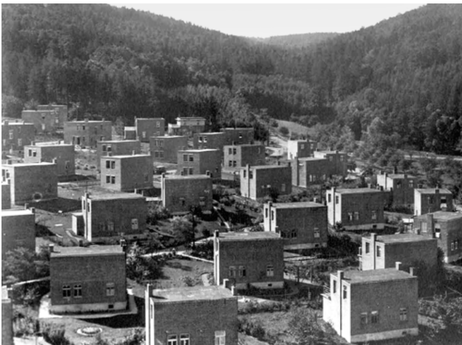
Nad Ovčírnou

kojový o 12 korun víc. Pozdravíme se a paní mi ukazuje dotazník, který v navštíveném domě vyplňuje. Hodnotí v něm úpravu zahrádky, pořádek a čistotu v bytě, estetický dojem vybavení bytu. Navíc zapisuje, zda