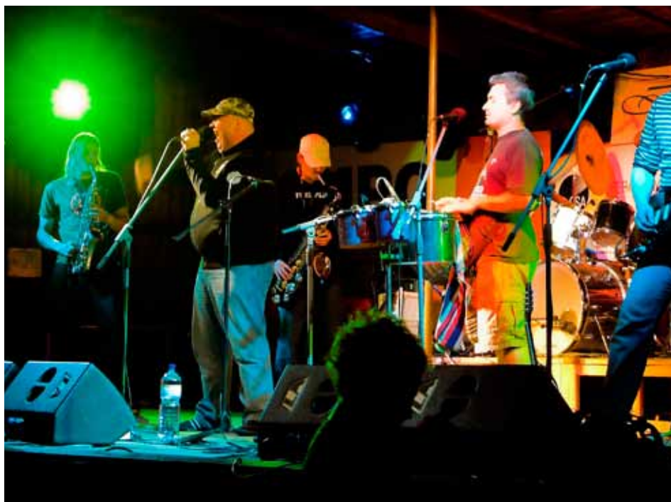
Čankišou vystoupí na náměstí Míru ve středu 27. dubna ve 20 hodin