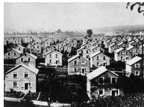
Čtvrť Zálešná

„Každý člověk, pokud nebydlí ve velkoměstě, měl by mít pro sebe dům, který by mu poskytoval zdravé bydlení podle potřeb