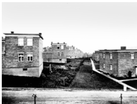
Rozestavěné domky na Dílech

Je těžké je naučit používat všechny místnosti ke svému účelu, přesvědčit je, že na zahrádkách nesmí chovat králíky a drůbež a pěstovat zeleninu. Všechno přece dostanou levně koupit v baťovských obchodech a zahrádka má sloužit jako potěcha pro oko a místo k odpočinku. Nájem přece není tak vysoký, aby toho bylo zapotřebí. To je pravda, vždyť za jednopokojový byt zaplatí nájemník týdně 15 korun a za třípo-