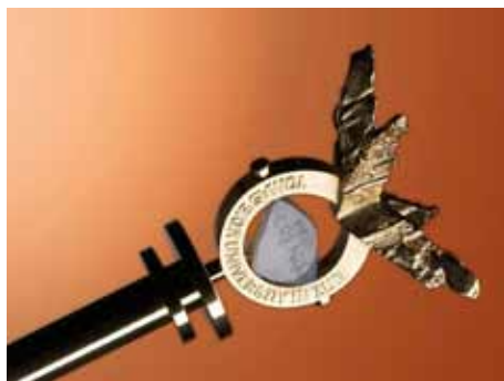
Insignie univerzity

při oficiálních akademických příležitostech, a podpořit tak sounáležitost občanů se Zlínskou univerzitou. [jb]