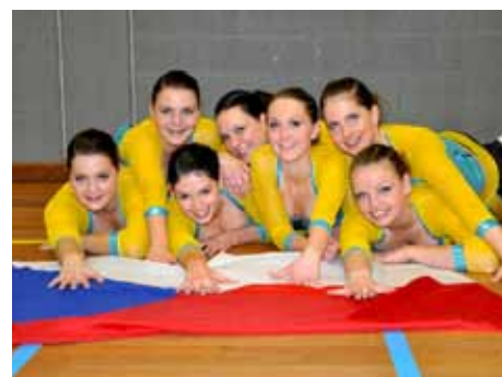
Úspěšný tým