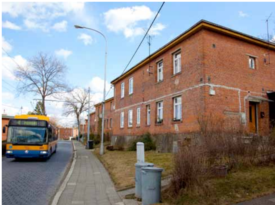
Tyto stavby jsou dokladem prudkého rozvoje firmy Baťa

Dagmar Nová, hlavní architektka města Zlína