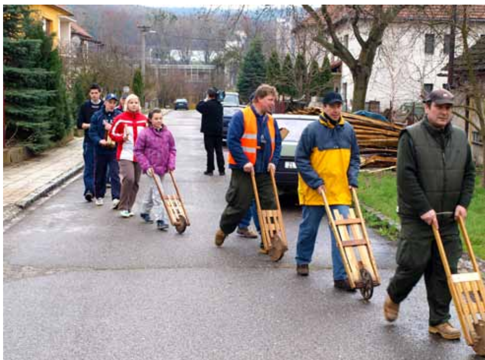
Hrkači v Loukách

Loni pár kluků obcházel i Mladcovou, tak snad se dají dohromady i letos a na obchůzku se můžete zajet podívat i do Štípy nebo na Klečůvku. Tradice ryze chlapeckých obchůzek se drží každý rok i ve Velíkové. A možná, že se najdou šikovní kluci i v dalších místních částech, dají hlavy dohromady a oživí tuto hezkou a zajímavou součást velikonocních svátků. Blanka Kovandová