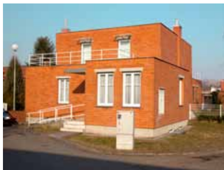
Bačovský půldomek

Jejich vlastníci mají se svým bydlením tolik problémů, že jim ten kousek zahrádky a zdánlivé soukromí vůbec nezávidím. Přestože v minulých dvaceti letech realizovali obdivuhodné množství rekonstrukčních prací, nic nezměnili na skutečnosti, že se snaží revitalizovat provizoria, jejichž stavebně-technická kondice měla dospět do stadia „úmrtí“ v 60. letech minulého století. Nestalo se tak z mnoha důvodů a asi v dohledném čase ani nestane. Současný stav tedy lze definovat jako jakýsi druh Potěmkinovy vesnice, jejíž jádro zůstává provizoriem a je více či méně úspěšně kamuflováno v předchozím textu popsány úpravami. Naším společným úkolem je najít řešení, co dál s bačovskými čtvrtěmi ne zítra, či za rok, ale za dvacet, padesát nebo sto let. V čase, kdy konečně uznáme, že provizoria přežívající skoro o 60 let svůj životní limit, bude potřeba postupně nahradit. Moje, zdůrazňuji moje subjektivní představa priorit, které je třeba při rekonstrukcích a nové výstavbě v bačovských čtvrtích respektovat, je následující: urbanistická struktura (červené kostky v zeleni), materiál (cihla) a výplně otvorů (okna, dveře) v rozšířeném sortimentu. Naplnění těchto tří pravidel by mohlo být výchozím principem pro novou výstavbu v bačovských čtvrtích. Diskuse může být vedena o velikosti nových „kostek“. Preferovat původní objem nebo jej uváženě změnit?! Vypsát na téma „Postupná revitalizace bačovských obytných čtvrtí“ mezinárodní architektonickou soutěž? Určitě ano! [red]