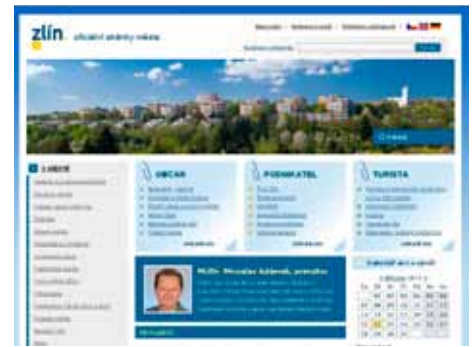
Zlín obsadil v kategorii měst druhé místo

Webové stránky města Zlína www.zlin.eu byly vyhodnoceny jako druhé nejlepší v letošním krajském kole soutěže Zlatý erb. Hodnotící porota ocenila jejich aktuálnost, strukturu i přehlednost. Vítězství si v kategorii měst odnesl Vsetín, který tak obhájil loňské prvenství. „Tohle ocenění je potvrzením slušného standardu, který naše webové stránky mají,“ konstatoval