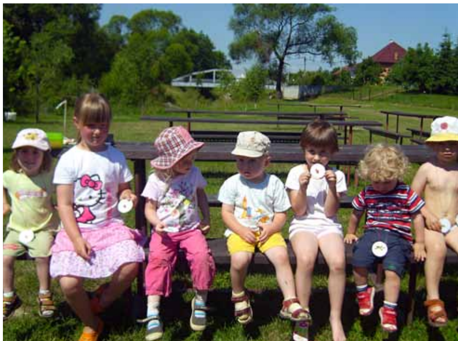
V létě na zahradě

Zlínské školky se také dočkají v tomto roce a v letech 2012 a 2013 rozsáhlých investic, aby splňovaly požadavky vyplývající ze zákona o ochraně veřejného zdraví a ze změn některých souvisejících zákonů. Na jejich modernizaci by bylo letos třeba částky 12,85 milionu korun. [dvo]