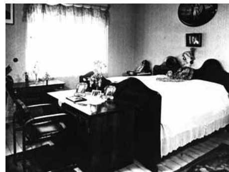
Ložnice v baťovském domku

Jenže teď si musím pospíšet, Zlín vstává časně, vždyť je všední den. Po půl sedmé už stojím na náměstí Práce a sleduji stále houstnoucí zástupy směřující ke vstupní bráně továrny. A najednou konec, všichni jsou na svých místech u strojů či stolů, náměstí je prázdné a ptáci, dosud umlčení těmi valícími se vlnami, se znovu rozepívají. Rozhlížím se kolem. Tam, kde při mé minulé návštěvě stálo několik továrních budov, pulsuje teď obr táhnoucí se do dálky a spojený tepnami ulic dole a nervy lanovek a dopravníků nahoře. Tam, kde tehdy stály první mansardové domky, stojí teď celá čtvrť a další je nade mnou. A vedle mne celý školní a internátní areál korunovaný nahoře elegantním Památníkem postave-