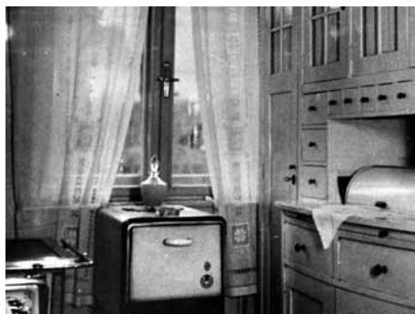
Kuchyně v baťovském domku

Už je ale čas vyrazit dál. Toto město se teď táhne k Vizovicím, obytné čtvrti jsou podél řeky Dřevnice až k Baťově nemocnici a protože to nestačí, začaly další ulice vyrůstat i na svazích naproti nim. Otevírá se přede mnou údolí Dřevnice a na obou březích se podél příčných ulic rozkládají v rovných řadách červené domky obklopené zelenými trávníky s pestrými skvrnami květinových záhonů. Za sedmdesát let budou řady porušeny dalšími domky vestavěnými mezi ně a nebudou již působit tak stroze, protože vysazené stromky, teď ještě příliš mladé, se rozkošatí a zahalí částečně své obyvatele do listnatého hávu.