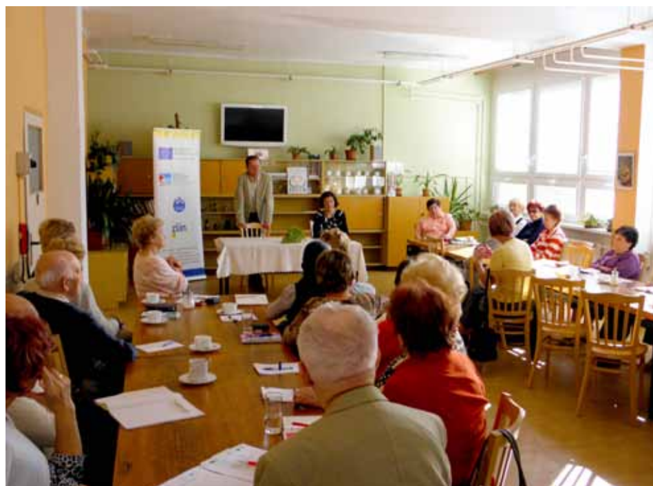
Oblast sociální péče patří k prioritám zlínské radnice

plánování sociálních služeb další projekt s názvem „Plánování sociálních služeb ve Zlíně“, jehož hlavním cílem bude zpracování nového střednědobého plánu na období 2013 - 2017, a který bude spolufinancován z prostředků Evropského sociálního fondu prostřednictvím Operačního programu Lidské zdroje a zaměstnanost a státního rozpočtu ČR. Ustanoveny budou čtyři pracovní skupiny (1. Děti, mládež, rodina, 2. Senioři, 3. Osoby se zdravotním postižením, 4. Osoby ohrožené sociálním vyloučením). Uvítáme zájem občanů a organizací zapojit se do těchto pracovních skupin (kontaktní osoba: Mgr. Pavlína Zubíčková, tel. 577 630 935, pavlinazubickova@muzlin.cz). [jp]