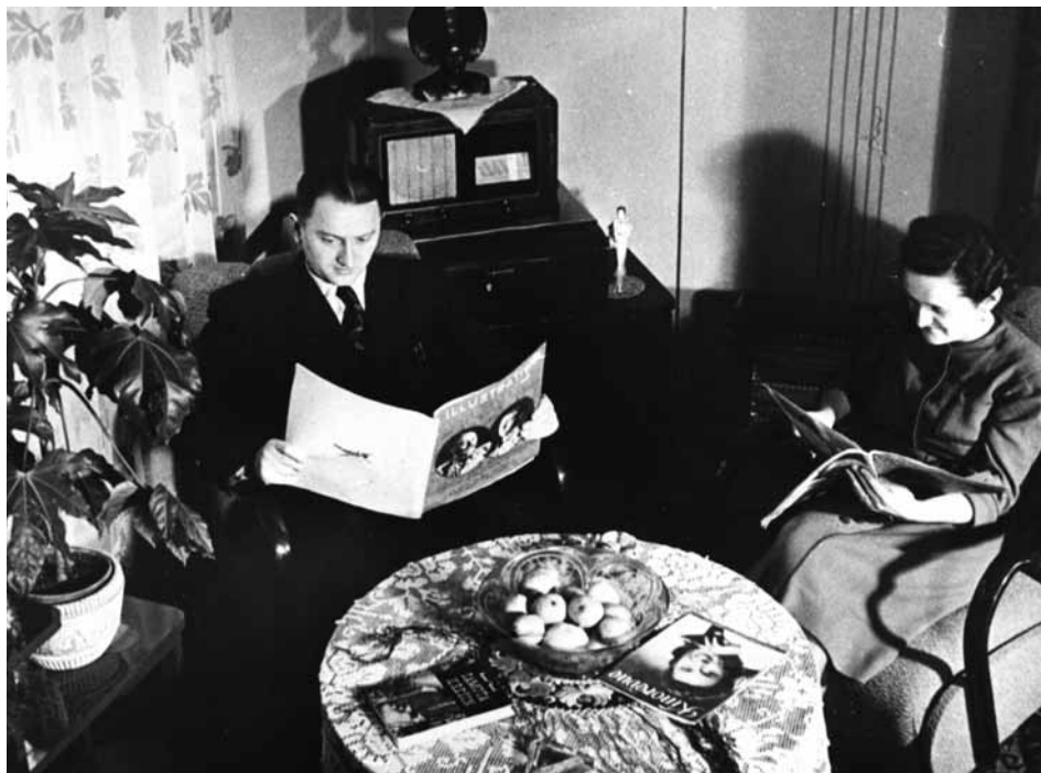
Obývací pokoj v baťovském domku

Probouzím se v moderně zařízeném pokoji hotelu Společenský dům ve Zlíně. Jednoduchý kovový nábytek, příkrývka s nápisem Baťa a za oknem krásné ráno. Den jako stvořený k prohlídce města, které láká tisíce zvědavých návštěvníků toužících přesvědčit se na vlastní oči, zda je to skutečně takový zázrak, jak se říká. Mám oproti nim výhodu. Jako cestovatel časem vím mnohem lépe než oni, jak tento zázrak vypadal v minulosti, a dokonce i to, co s ním bude v dalších letech.