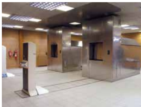
Moderní pec krematoria.