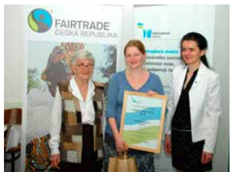
Certifikát pro zlínský sbor.

Sbor Českobratrské církve evangelické ve Zlíně obdržel 16. dubna certifikát Fairtradový sbor. Ocenění zlínskému evangelickému sboru bylo přiděleno na základě splnění kritérií, mezi něž patří například konzumace fairtradových produktů (čaj, káva, cukr, čokoláda) při aktivitách sboru nebo prodej výrobků, který farní sbor pořádá dvakrát v roce – při akci Noc kostelů v měsíci květnu a pak v adventním čase. V západní Evropě je fairtradových církví řada. V Anglii je do podpory Fair trade zapojeno přes 4 000 kostelů. Mimo křesťanské církve jsou ve Velké Británii také fairtradové synagogy, mešity nebo buddhistické a hinduistické chrámy. [JV]