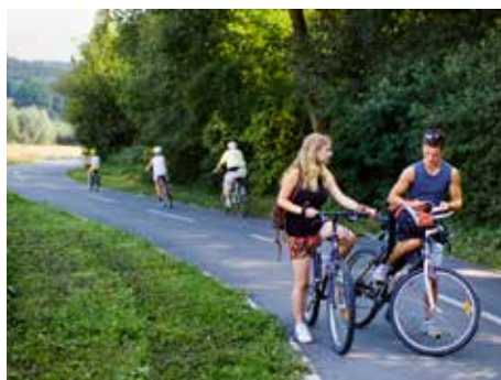
Cyklostezka ve Zlíně.

Výjezd táhlým stoupáním ze Zlína na Mladcovou (restaurace Bartošův dům), po silnici na Rackovou, rozcestí Soudná. Klesání do Rackové a pak cesta údolím směrem na Lehotice, Mysločovice, Sazovice (sportovní areál s koupalištěm) a Tečovice (původně románský kostelík). Za Tečovicemi napojení na cyklostezku 471 přes Louky a Prštné do Zlína