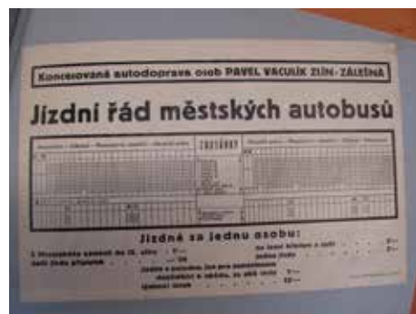
Ukázka tehdejšího jízdního řádu.