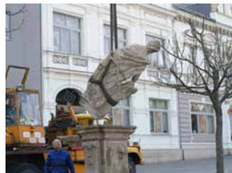
Socha sv. Donáta se ocitla ve vzduchu.