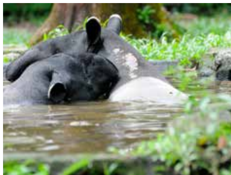
Tapíři ve zlínské zoo.

Rok 2013 bude v Zoo Zlín rokem tapírů čabrakových. Tato nádherná černobíle zbarvená zvířata, která je možné vidět pouze v několika evropských zoo, mají svou novou expozici s tajuplným názvem HALA-BALA na místě původního rybníka gibbonů v dolní části areálu. Kromě tapírů se stane domovem také pro rodinu asijských primátů siamangů a různé druhy vodního ptactva. Název expozice tapírů je odvozen od pojmenování významné rezervace v jižním Thajsku, která se jmenuje HALA-BALA. V tomto chráněném území možná jako v jediném na území Thajska žijí pospolu tapíři čabrakoví a také siamangové. [red]