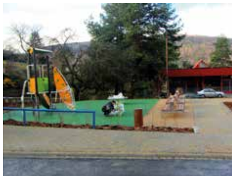
Z bývalé točny je velmi příjemné místo.