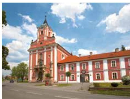
Náměstí před rekonstrukcí...