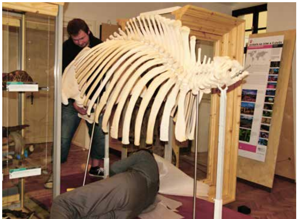
Vidět kostru slona je možné v České republice pouze na hradě v Malenovicích.

Mezi vystavenými exponáty bude například i jeseter velký, který měří dva a půl metru, krokodýl kubánský, lev, levhart, kostra pštrosa, odlitek vejce vyhynulého pštrosa obrovského, které má objem 16 litrů. V oddělení moře a oceány bude vystavený kel narvala, krunyř karety pravé, výběžek pilouna, preparát žraločích čelistí, mořský koník, d'as mořský, muréna a parejнок okatý. Nebudou chybět ptáci, například tři druhy rajek, nebo kolibříci a velcí exotičtí brouci. [sve]