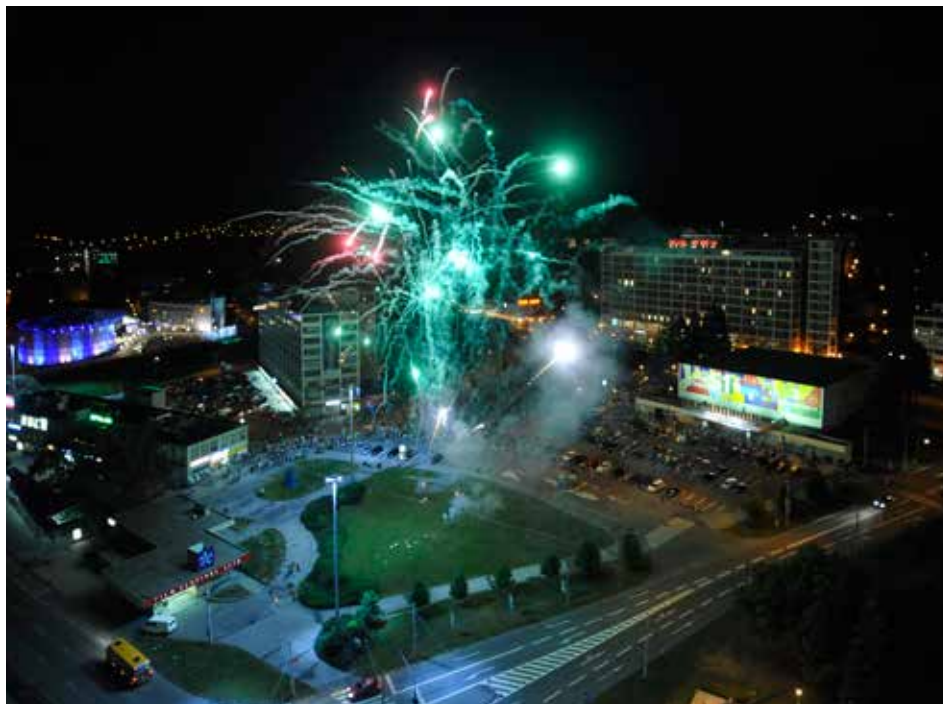
Filmový festival pro děti a mládež je každý rok jednou z nejvýznamnějších akcí ve Zlíně.

Divadlo v nové sezoně s podtitulem „Cher- chez La Femme“ opět nabízí několik variant předplatného. Velkou výhodou všech je sle- va na vstupném, až třicet procent. Novinkou je například „hlídací služba“ pro maminky s malými dětmi nebo společně Komorní před- platné do Studia Z a Dílny 9472.