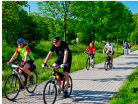
Cyklostezku na Vršavě čeká rekonstrukce

Právě to, že město ještě nemá zbylé dva pozemky ve svém vlastnictví, je největším současným problémem výstavby cyklostezek Zlín – Otrokovice. „Jednání jsou komplikovaná, zvláště v případě jednoho z nich. Je ve vlastnictví firmy, která je v likvidaci, i proto se nám dosud nepodařilo dojed-