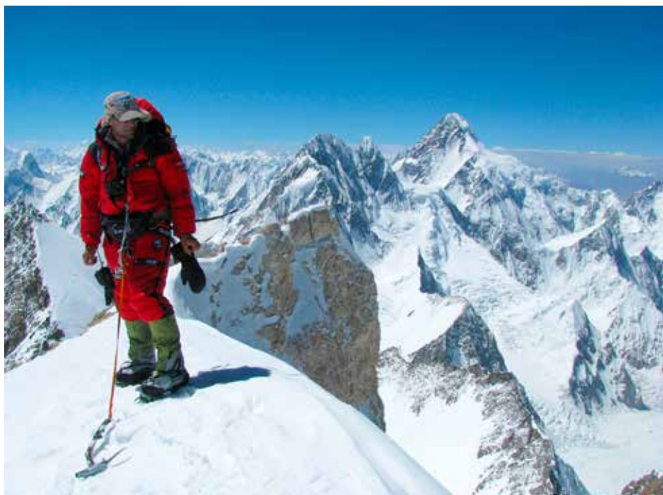
Radek Jaroš vystoupil už na 13 ze 14 osmitisícovek

Radek Jaroš je v současnosti nejúspěšnější český horolezec, když dosud zdolal 13 ze 14 osmitisícových vrcholů. Za záchranu života několika horolezců obdržel v roce 2009 hlavní cenu Fair Play od Českého olympijského výboru. V následujícím roce i od Evropského hnutí fair play.