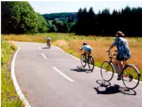
Cyklostezka do Kostelce.

Handicap v délce cyklostezek současně vedení města intenzívně odstraňuje. Dokončení páteřní cyklostezky spojující Zlín