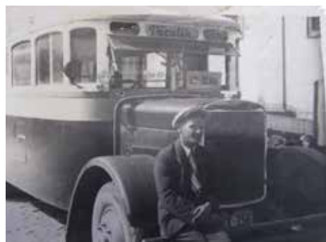
Autobus firmy Vaculík.