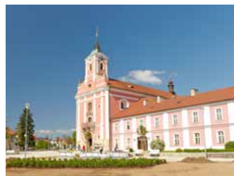
...a po rekonstrukci