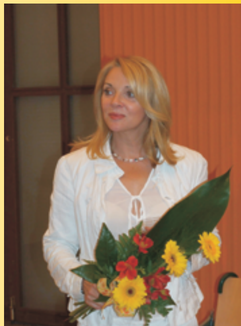
Patronka festivalu - slovenská herečka Zdena Studénková