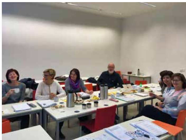
Výuku provází příjemná atmosféra.

Motivace našich studentů bývá často velmi rozmanitá: dorozumění se v zahraničí, obnovení vědomostí a dovedností a získání nových, nutnost domluvit se ve vlastní rodině s příbuznými a přáteli, či velmi prozaická: jsem chronický začátečník a chci to změnit. Každý semestr se setkáváme celkem 8krát. Kurz se koná jedenkrát za 14 dní a výuka trvá 100 minut. V hodinách se nesoustředíme pouze na jazyk jako takový, ale naši lektori se snaží výuku obohatit o informace z kulturního prostředí anglicky mluvících zemí. Probíráme témata, jako jsou svátky, tradiční jídlo, Brexit, události v královské rodině, volby, kinematografie, literatura či umění. Každoročně pořádáme akci „vánoční punč“, při které nesmí chybět kolody, povídání o anglo-amerických zvycích a tradicích a v neposlední řadě něco dobrého na zub. Vyučující našich kurzů se vždy snaží reagovat na aktuální situaci, připravují si zajímavé články či videa, která reflektují dění ve světě. Velký úspěch mají také workshopy