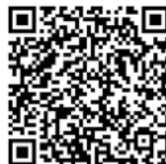
QR kód iOS

zdrojů pro naše město zajišťuje kolektivní systém EKOLAMP, který v České republice funguje již od roku 2005. Vytváří síť sběrných míst a plně hradí přepravu sběrných kontejnerů do recyklační firmy i samotnou recyklaci. Více o problematice nakládání s nefunkčními zářivkami na www.ekolamp.cz . [red]