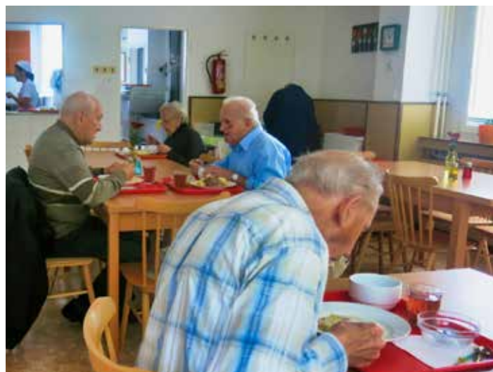
V jídelně na Podhoří chutná. / foto: Irena Orságová

Došlo navíc k propojení s informačním systémem Městské policie Zlín. Při správě a kontrole režimu parkování tak oba městské subjekty sdílejí potřebná data online. [tsz]