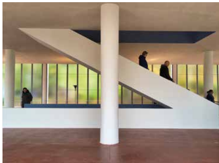
Interiér památníku má své neopakovatelné kouzlo.

Vstupné bude v uvedeném období takřka symbolické. Základní je ve výši 40 korun, snížené bude stát polovinu. Mimo otevřací dny je možné si prohlídku pro skupiny či jednotlivce předem objednat, je však nutné počítat s padesátiprocentním příplatkem. Vstupenky bude možné zakoupit v infopointu, který se nachází v nedaleké budově gymnázia. Koncem dubna bude objekt na dva týdny uzavřen, aby mohla být položena litá dlažba na ploše u zadního vchodu do památníku a mohly proběhnout drobné opravy. O časové výluce bude veřejnost v předstihu informována,