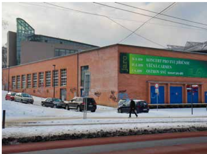
Současná tělocvična pochází z 30. let minulého století.

Novostavba tělocvičny bude vycházet z polohy i parametrů současné stavby, přesto by měla být o něco širší i vyšší, aby došlo k zvětšení prostoru pro výuku tělesné výchovy a sportování. Vybudován bude víceúčelový sál a sál pro gymnastiku. Součástí bude sociální zázemí a sklad náčiní. „Velký důraz chceme klást na vnější podobu budovy, která bude respektovat požadavky na architektonicko-urbanistický kontext oblasti, kde se tělocvična nachází. Součástí bude také úprava technologické části pro potřeby DSZO,“ doplnil Ivo Tuček , vedoucí Oddělení prostorového plánování magistrátu. [dvo]