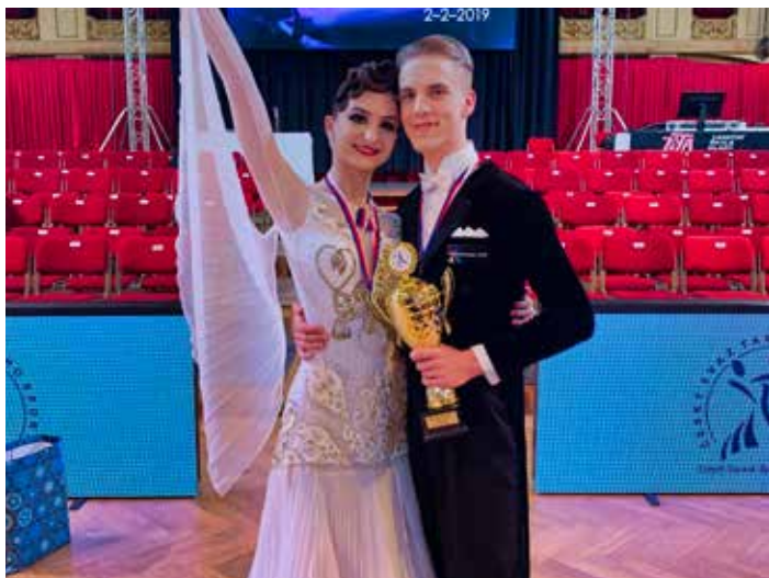
Taneční pár obhájil dvojí vítězství.