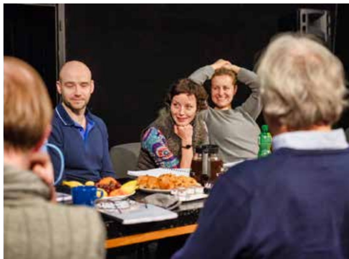
Komedie z vědeckého prostředí.