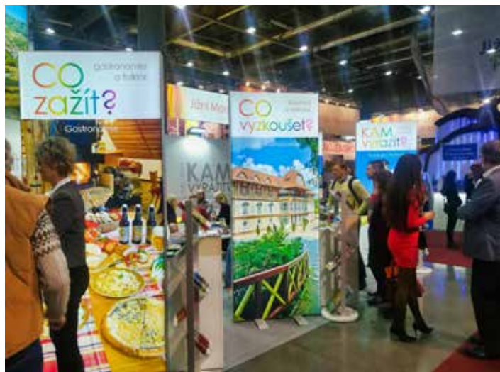
Region se nyní prezentuje novou formou. / foto: MMZ

Podle nového konceptu se zájemci o návštěvu kraje dozví, CO VIDĚT – zde budou prezentovány zejména památky, historické a kulturní cíle, atraktivita. Dostanou doporučení KAM VYRAZIT. Dominovat bude nabídka pro turisty všech kategorií – pěší turisté, cykloturisté, motoristé. Region také nabídne turistické průvodce, mapy, poradenství. Pro ty, kteří