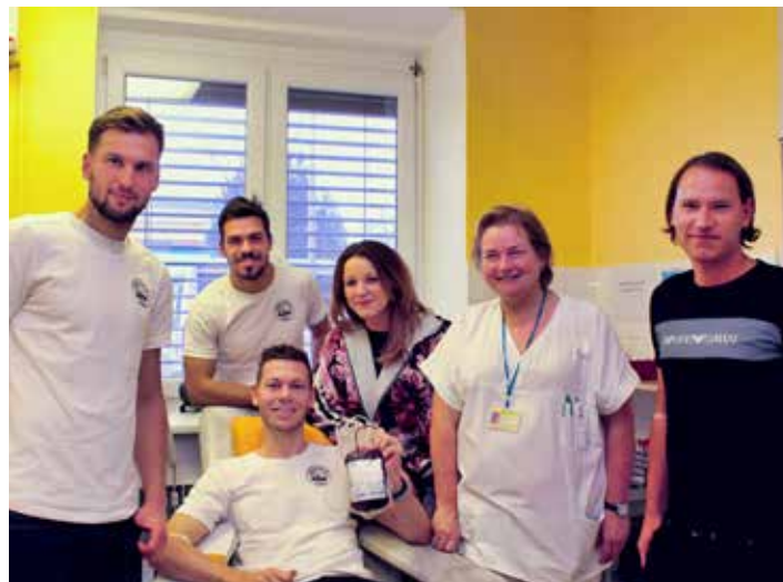
Fotbalisté Fastavu pomáhají dobré věci.

Dárců krve ve Zlíně přibývá. Za rok 2018 eviduje zlínská transfuzní stanice celkem 10 616 odběrů krve, což je o téměř 500 více než v roce 2017. [dl]