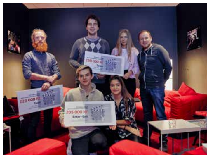
Studenti točí ve Zlíně filmy.

Grant IS Produkce 223 000 Kč – finanční: 50 000 Kč, nefinanční: 173 000 Kč (pronájem techniky)