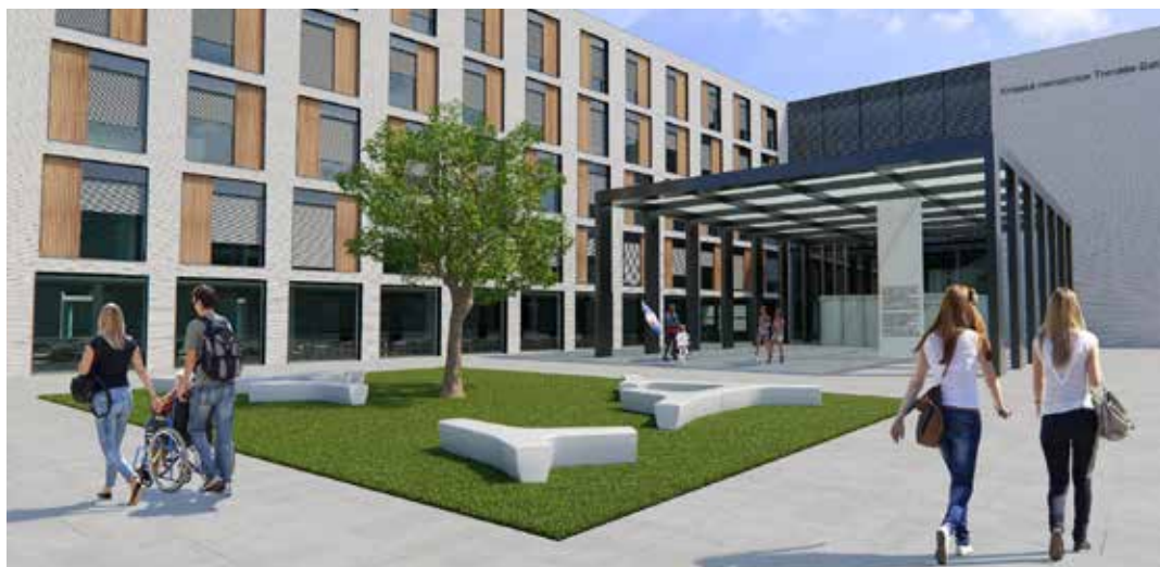
Vstup do nové nemocnice.

Moravská vodárenská, a. s., plánuje na rok 2019 opět opravy infrastruktury, kterou má od VaKu pronajatou, za celkových 68 milionů Kč. [vak]