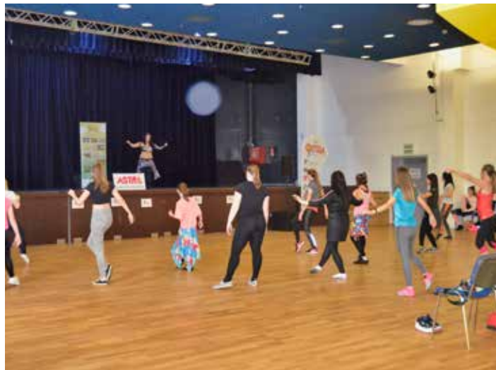
Taneční workshop se dočká pokračování.

těže TanceR Cup. Uskuteční se 30. března a pokud dorazí jako obvykle na 1200 tanečnicků z celé České a Slovenské republiky, tak se milovníci tance – a v tomto případě i soutěžení – mají na co těšit. [io]