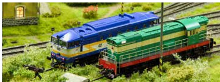
Filmový uzel zaplní vláčky.

vedle historického vlaku taženého parní lokomotivou. Výstava otevřívá v 9 hodin. [io]