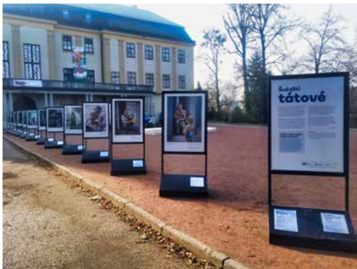
Výstava zpestřuje prostor před zámkem.