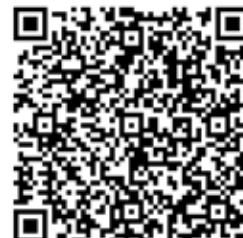
QR kód Android