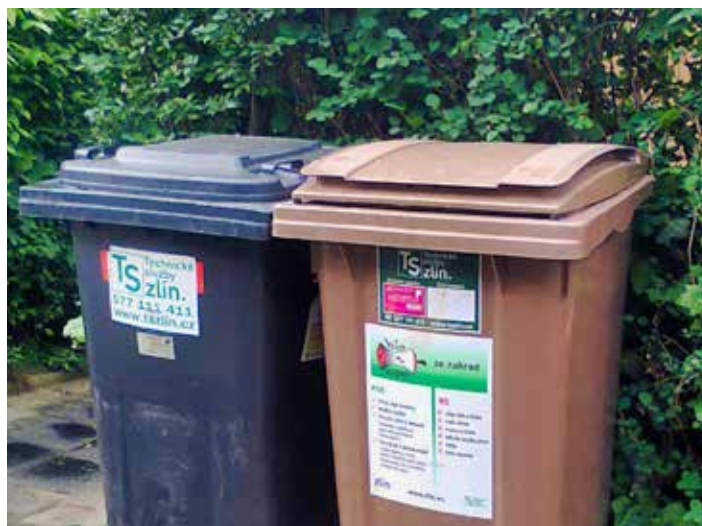
Nádoby na bioodpad mají hnědou barvu.

- svoz v pondělky (počátek svozu 1. 4. 2019) tř. T. Bati: č.p. 39; 1560; 2370; 2371; 2521; 2691; 2692; 2693; 2694; 3011; 3062; 3224; 3225; 6515 - svoz v úterky (počátek svozu 2. 4. 2019) ul. bratří Jaroňků: 19; 20; 148; 215 Díly II: 185; 3008; 3123; 5521 Díly III: 79; 157; 2893 Dlouhá: 110; 112; 497 Kvítková: 82; 109; 119; 123; 253; 370; 373; 475; 526; 664; 673; 676; 677; 683; 686; 689; 690; 703; 704; 705; 706; 780; 1576; 2434; 2898; 3247; 3581; 3643; 5279; 6965